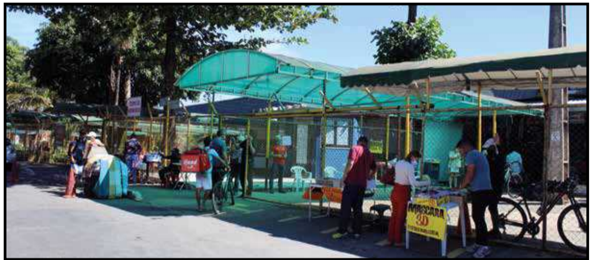
Feira do Guará finalmente receberá reformas significativas

O presidente da Novacap informa que o projeto de recuperação das feiras do DF, o “Feira Legal”, vai começar pela Feira do Guará: “Já temos a