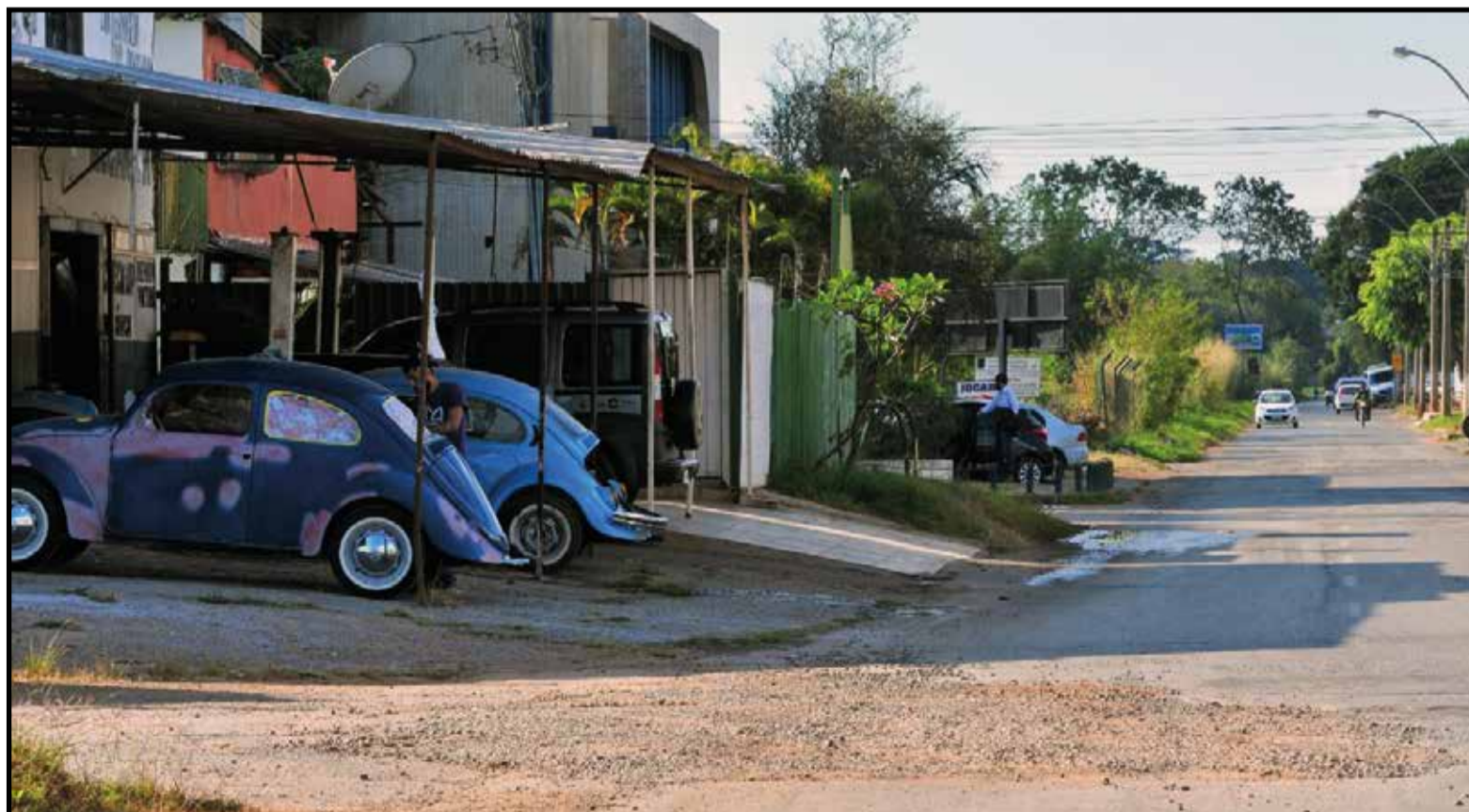
GDF fará as mesmas melhorias no Setor de Oficinas Sul, vizinho ao SGCV. Serão implementados 6,4 mil metros de drenagem e 9,7 mil metros de pavimentação

Situado na Quadra 1, o centro automotivo de Rogério Paulo Alves, 33, já ficou completamente alagado. A rua onde está seu comércio também não possui escoamento. “Aqui temos de andar barco quando chove. Basta chover um pouquinho para a água invadir a minha loja”, relatou. “Essa obra vai melhorar bastante o nosso trabalho”, acredita.