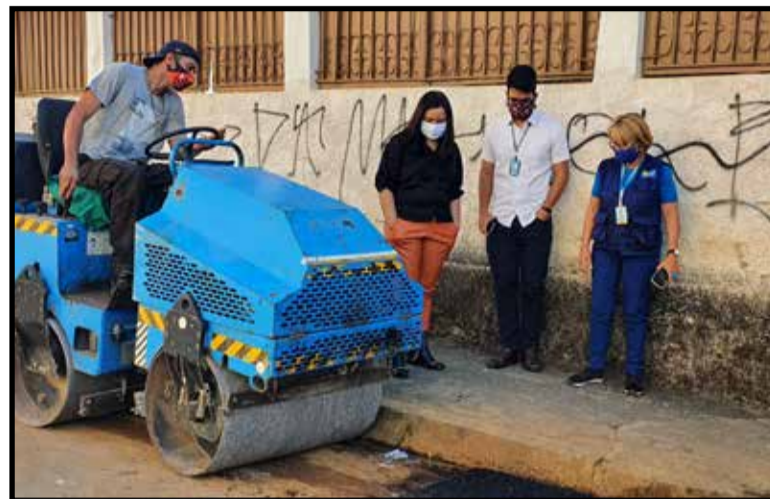
"GDF Presente" est na cidade, em mais uma edio, sob a coordenao do Polo Central em parceria com a Administrao

A limpeza  outro eixo importante, e na cidade, at esta sexta-feira, 10 de julho, j foram retiradas 110 toneladas de entulho descartado de forma irregular em reas pblicas.