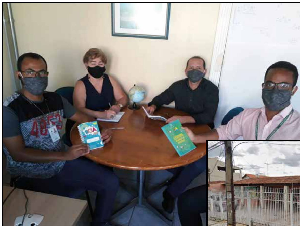
Os conselheiros recebem vítimas e usuários na sede do Conselho Tutelar na QE 26 com toda a segurança sanitária

Outra demanda recorrente nesse período de pandemia é a situação de conflito entre pais separados com guarda compartilhada dos filhos. “Por causa da preocupação com idosos em casa, muitos pais e mães evitam pegar os filhos na data estipulada pela Justiça, sobrecar-