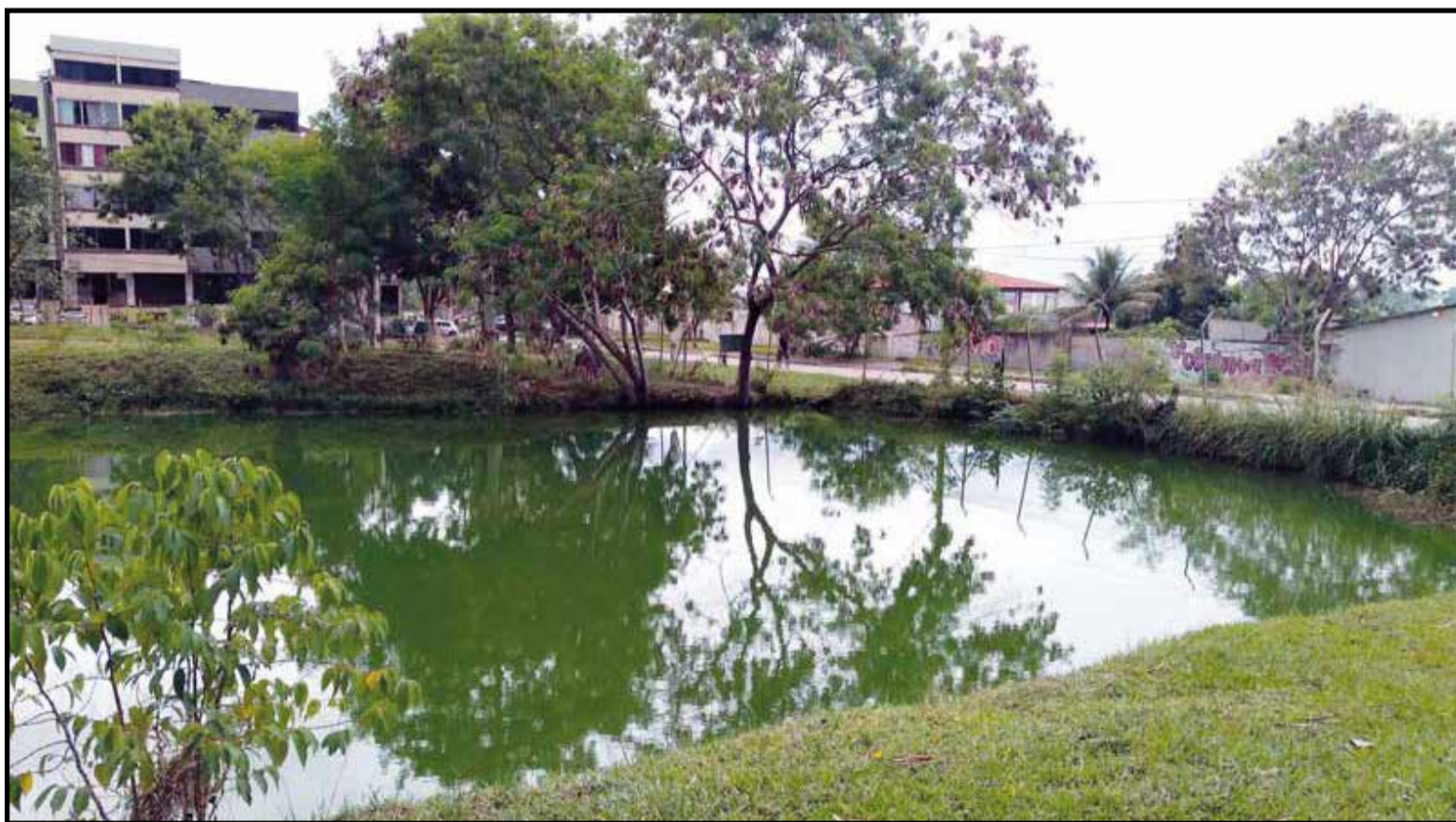
Parque Dener, agora sob responsabilidade da Administração, será finalmente revitalizado

O calendário para execução será definido em breve, mas a previsão de conclusão de todas as intervenções é 31 de dezembro deste ano. De