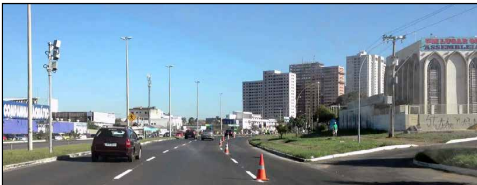
Investimentos incluem também recuperação de asfalto e melhoria de iluminação pública

De acordo com a SSP, a previsão é que a instalação seja iniciada no fim desse mês. “O principal critério ocorre de acordo com as manchas criminais, mapas de análise