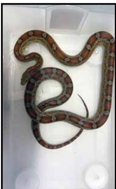
A polícia recolheu outra cobra, de origem americana, no apartamento do estudando no Guar II

Na quinta-feira, 16 de julho, a Polícia Civil voltou ao apartamento do estudante para cumprir novo mandado de busca e apreensão à pro-