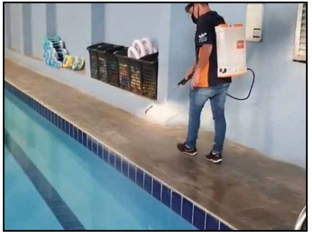
Reabertura de espaços, como a Água Vida, ameniza a angústia do isolamento social. Academia precisou mudar a própria rotina para oferecer segurança biológica aos frequentadores

Com a reabertura autorizada pelo Governo do Distrito Federal e pela Justiça, as academias estão adaptadas para voltar a receber seus frequentadores. Os ambientes, que já eram higienizados constantemente, passam agora a cumprir rígidos protocolos de higiene determinados pela Organização Mundial de Saúde.