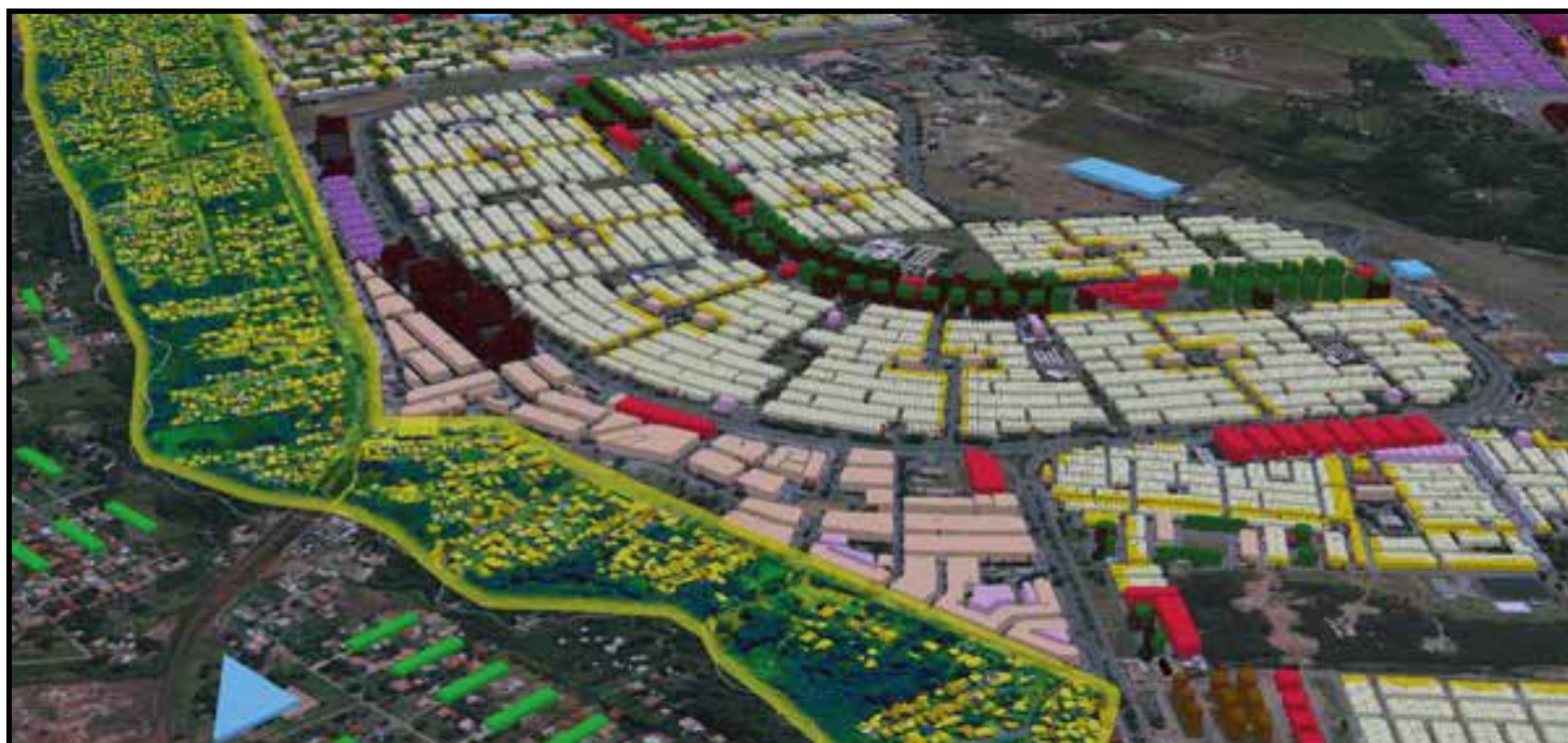
Os três condomínios horizontais (em verde) serão regularizados até 2021, promete o governo

Se aprovado, o Projeto de Lei nº 925/20 estabelece que as Colônias Agrícolas Iapi (também conhecido como Setor de Mansões Iapi), Colônia Agrícola Águas Claras (conhecida como Guarás Park) e a Colônia Agrícola Bernardo Sayão passarão a ser chamadas de Setor Residencial Guarás Park. Inicialmente, o nome sugerido e que estava sendo considerado pelo governo do