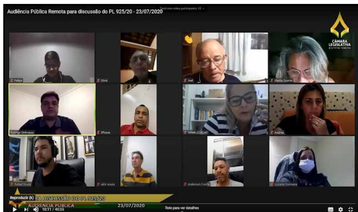
Por causa da pandemia, audiência foi realizada pelo aplicativo Zoom