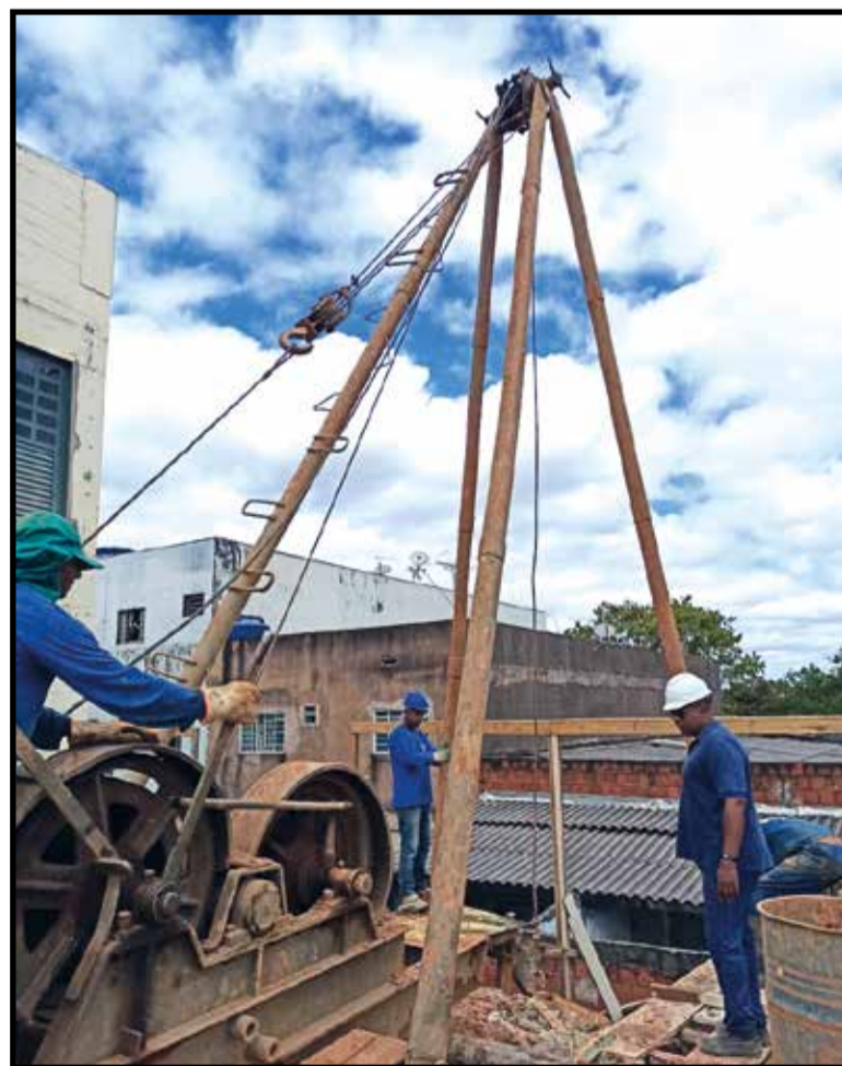
Obra deve ser concluída até novembro, se não faltar dinheiro para a continuação

Mas não é somente a obra física que precisa de recursos financeiros. Mesmo sem a presença dos 350 jovens de 4 a 14 anos que atende, a Santo Aníbal continua funcionando de segunda a sábado, com o fornecimento de cestas básicas, material de higiene e limpeza às famílias dos atendidos e da demanda espontânea. "Nessa parada forçada, estamos trabalhando o fortalecimento dos vínculos nossos com as crianças e adolescentes e com as famílias deles, com atividades socioeducativas entregues semanalmente", explica a diretora. Cada atividade é preparada de acordo com a idade e nível