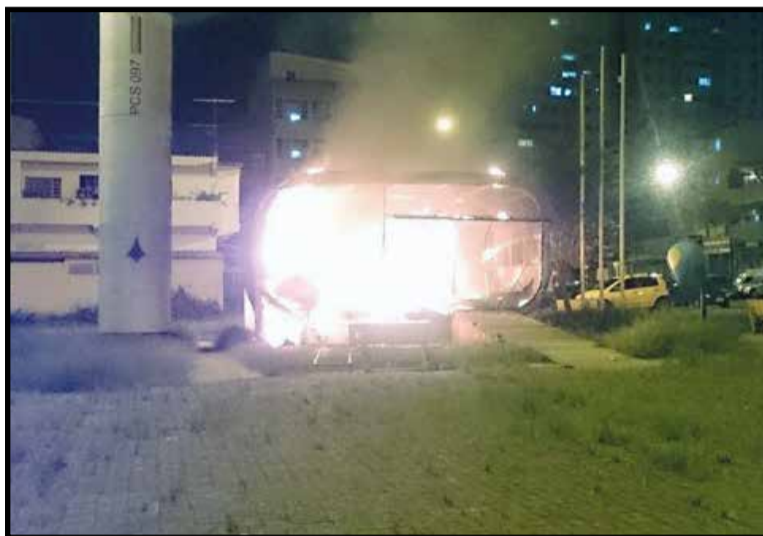
Posto policial ficava na Praça Itajubá, no centro da QE 40

Segundo o juiz da da 7ª Vara da Fazenda Pública, responsável pelo julgamento do caso, a responsabilidade dos réus foi apurada em procedimento administrativo, nos quais constam, entre outros, o depoimento de testemunhas e do réu maior de idade, que chegou a ser condenado, na esfera penal, pelo incêndio e, ainda, declarações prestadas pelo