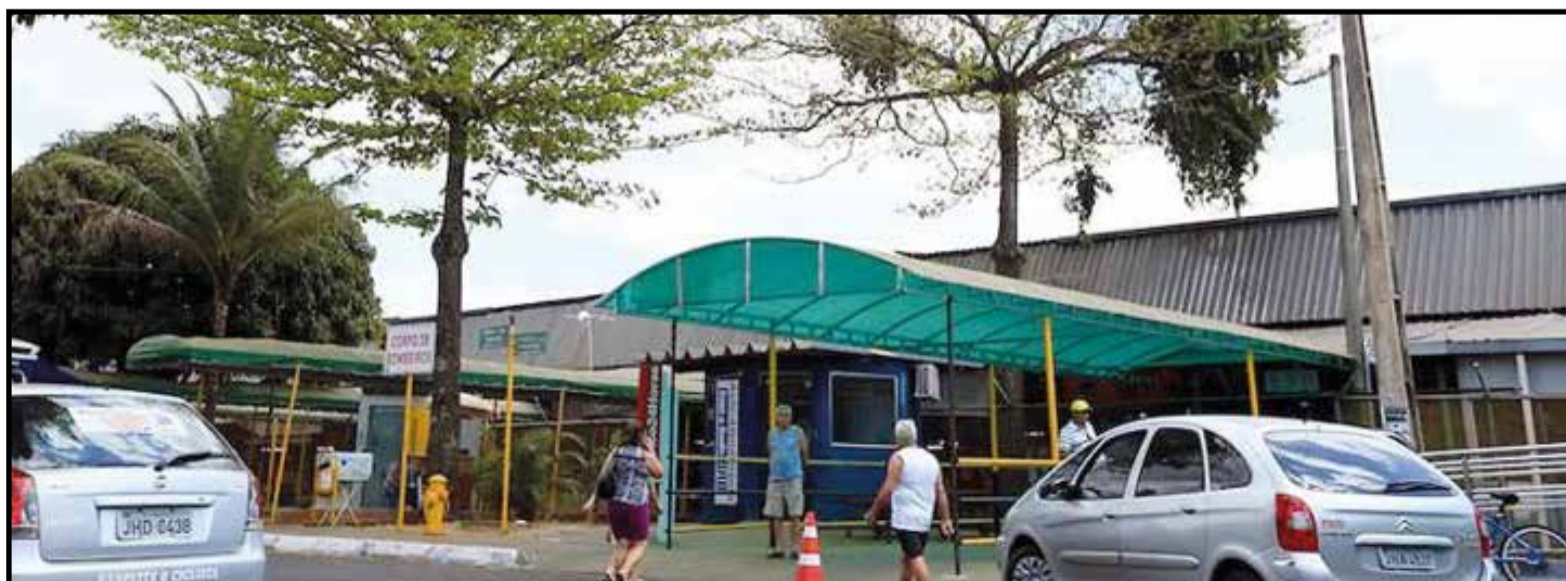
A maior obra é a da Feira, ao custo de R$ 40 milhões

Outra obra significativa é a duplicação da via entre Guará e Núcleo Bandeirante, uma demanda antiga que vem sendo prometida sucessivamente há quatro governos do DF. Está prevista a construção de uma parte da obra, que tem orçamen-