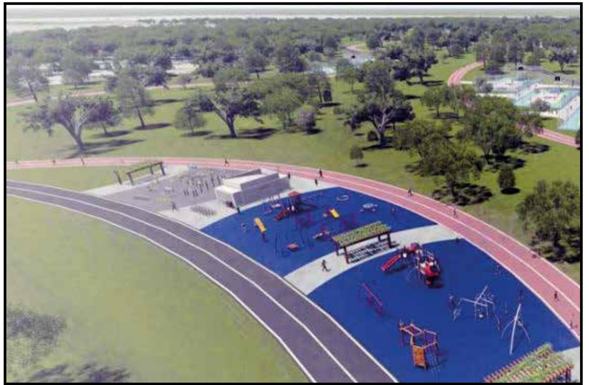
O parque Ezechias Heringer (Parque do Guará) será revitalizado com a implantação da parte recreativa, por R$ 24 milhões

Outra demanda antiga que será atendida será a reforma de todos os campos de grama sintética e os parques infantis da cidade, que não recebem manutenção desde quando