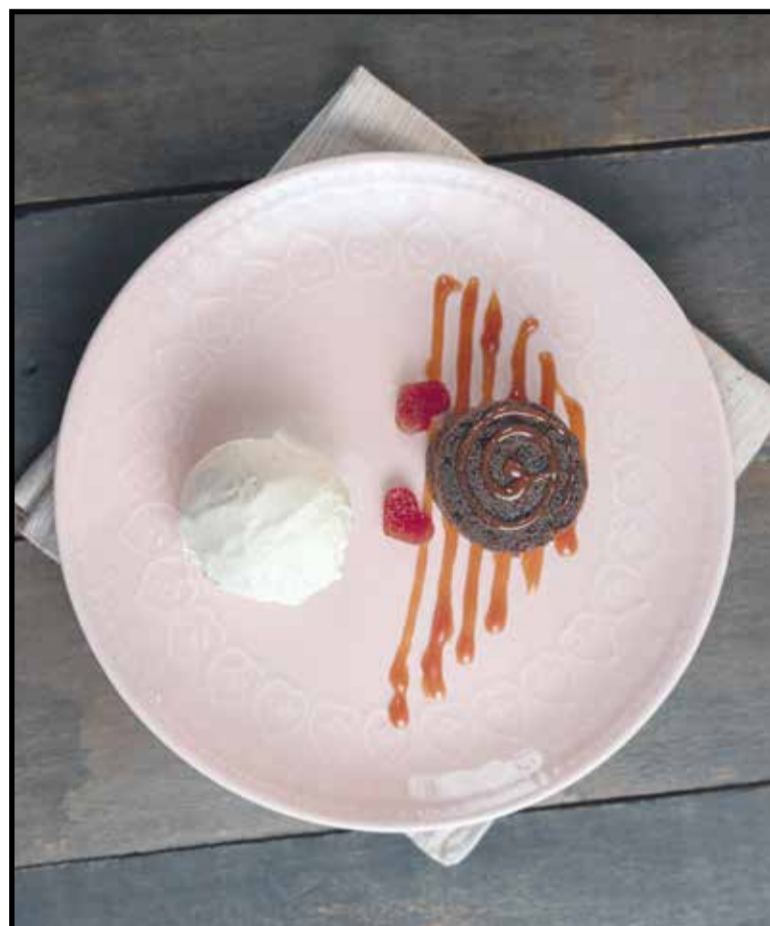
Bolo de goiabada, calda de goiaba e sorvete de queijo é a versão do Romeu e Julietada cantina

Este ano há opções veganas no almoço e jantar (R$ 58,90 por pessoa) que incluem uma parmegiana de berinjela com purê de mandioquinha ou um tagliatelle com cogumelos frescos finali-