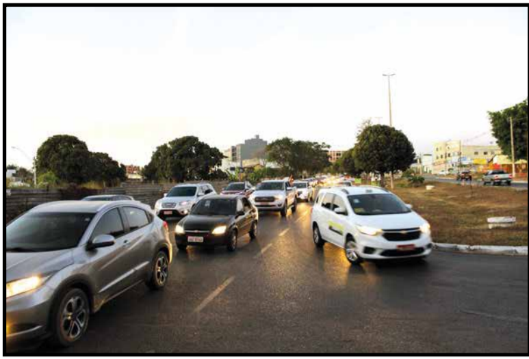
A duplicação da via Guará-Núcleo Bandeirante finalmente vai sair do papel