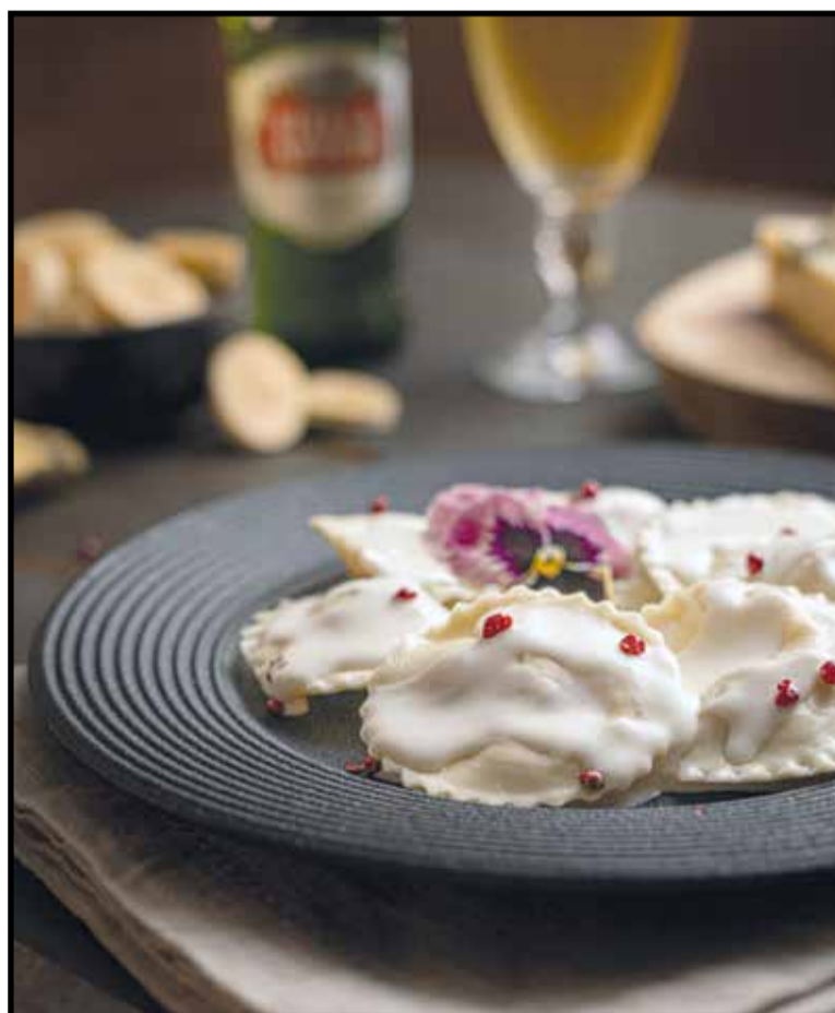
Raviólis autorais são opções de prato principal do festival no Nonna Augusta