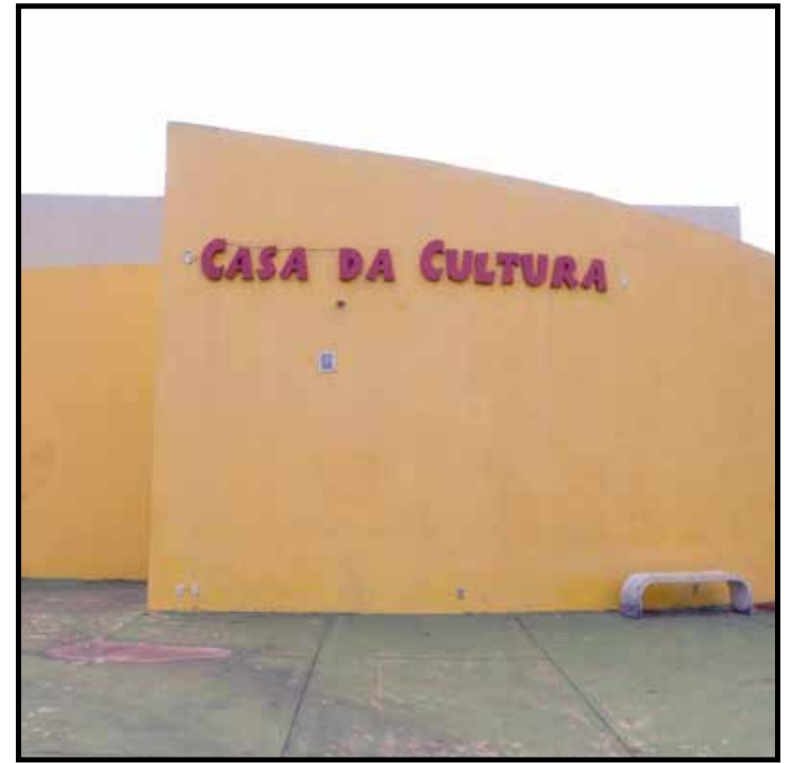
Prédio da Casa da Cultura vai abrigar cursos de capacitação para jovens

O deputado acredita que, a partir da explicação do que a Casa da Cultura e da Juventude vai oferecer, a re-