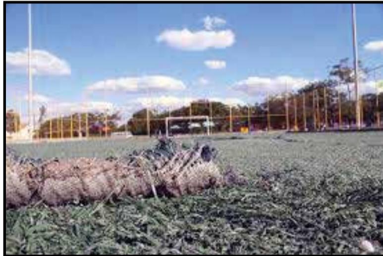
Sem manutenção há 10 anos, os campos sintéticos serão todos reformados

to total de R$ 33 milhões, mas nessa primeira será construída a ponte sobre o córrego Vicente Pires e a duplicação de cerca de 1 quilômetro até o trevo de acesso ao Park Way, com investimentos de R$ 11 milhões. O projeto está pronto desde o governo Rollemberg e a obra licitada