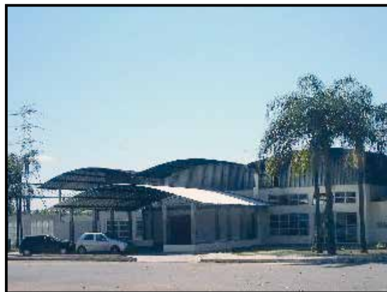
Da acanhada sede da QE 7, o Cilg vai para as confortáveis instalações do Salão de Múltiplas Funções