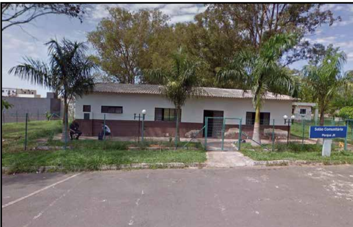
Salão Comunitário da QE 42 será adaptado para ser a base do Samu

Na área da Juventude, foi anunciada a doação de 15 computadores para a Casa da Cultura, que passa a ter a palavra Juventude incorporada à sua denominação, e que vai se transformar também num centro de capacitação de jovens.