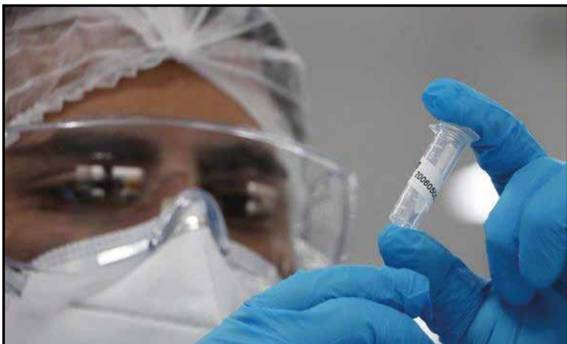
O Guará está em 6º lugar na classificação por casos confirmado, e tem 152 mortes

O boletim informa que 182.287 pessoas estão recuperadas na capital - 94,4% do total de diagnosticados. Entre os óbitos, 3.010 vítimas eram moradores do Distrito Federal. As demais 266 vie-