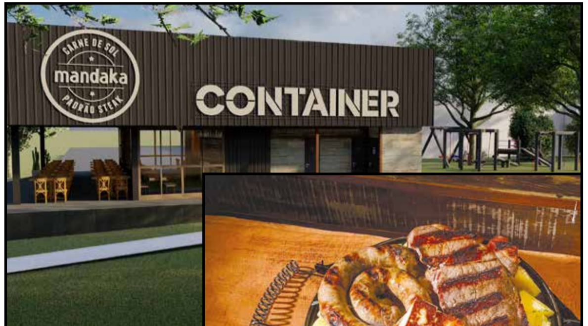
Cortes nobres de carne, assados na parrilla, são o carro chefe da casa

Pensando nisso, ajustou o horário para que funcione somente das 11h às 23h e optou por não trabalhar com música ao vivo e transmissão de jogos. Precisamos que as pessoas enxerguem aquilo ali como uma coisa boa e fiquem tranquilas que não é um lugar de farra ou barulho, é um local onde as pessoas podem ir com sua família