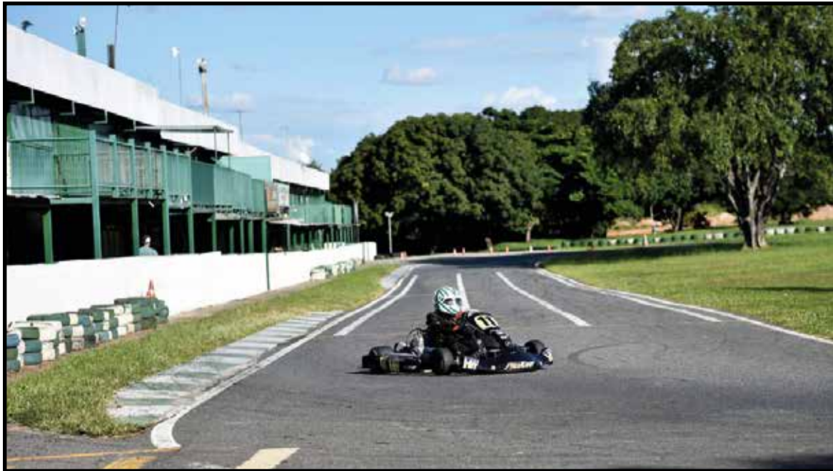
Nem a pista atual será mantida, porque não atende aos padrões nacionais e internacionais

rante 30 anos, pagando uma parte ao governo, como foi feito no Centro de Convenções Ulisses Guimarães e mais recentemente com o complexo do estádio Mané Garrincha.