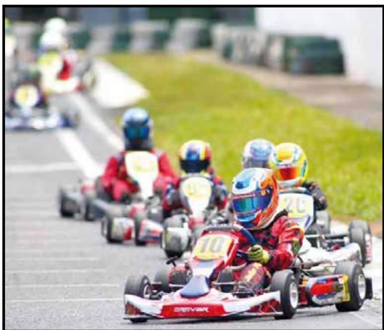
Além das competições, o novo kartódromo vai poder oferecer atividades para amadores

A ideia de privatizar o kartódromo surgiu em 2018, quando o governador Rodrigo Rollemberg anunciou a intenção do governo de privatizar todo o complexo do Cave, na modalidade conhecida como Parceria Público-Privada (PPP), em que o concessionário administra e investe no espaço público e o explora du-