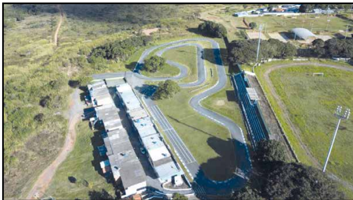
O que existe hoje de edificação será todo demolido, de acordo com o projeto

do pela Secretaria de Projetos Especiais, a concessão do Kartódromo se dará pelo regime de Concessão de Obra Pública, modelo em que o concessionário investe no espaço e ainda paga um determinado valor enquanto durar a concessão, que neste caso será de 30 anos, prorrogáveis por mais 5 anos. O valor do contrato é de R$ 13,4 milhões, que correspondem aos valores estimados para a realização dos investimentos obrigatórios.