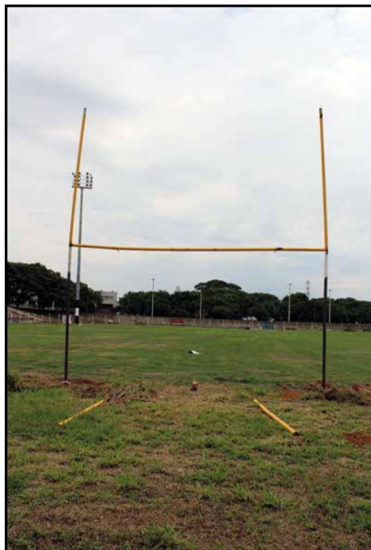
O gramado está sendo recuperado e adaptado para uso do futebol americano

no estádio Mané Garrincha. A proposta do governo Agnelo Queiroz e depois confirmada pelo governo Rollemberg é que o estádio do Cave fosse um apêndice do estádio Mané Garrincha, onde seriam realizados espetáculos de menor apelo de público. Pelo projeto, o Cave teria 6.600 cadeiras, capacidade considerada ideal para jogos do futebol brasileiro e shows e eventos menores, que o transformaria numa arena multiuso.