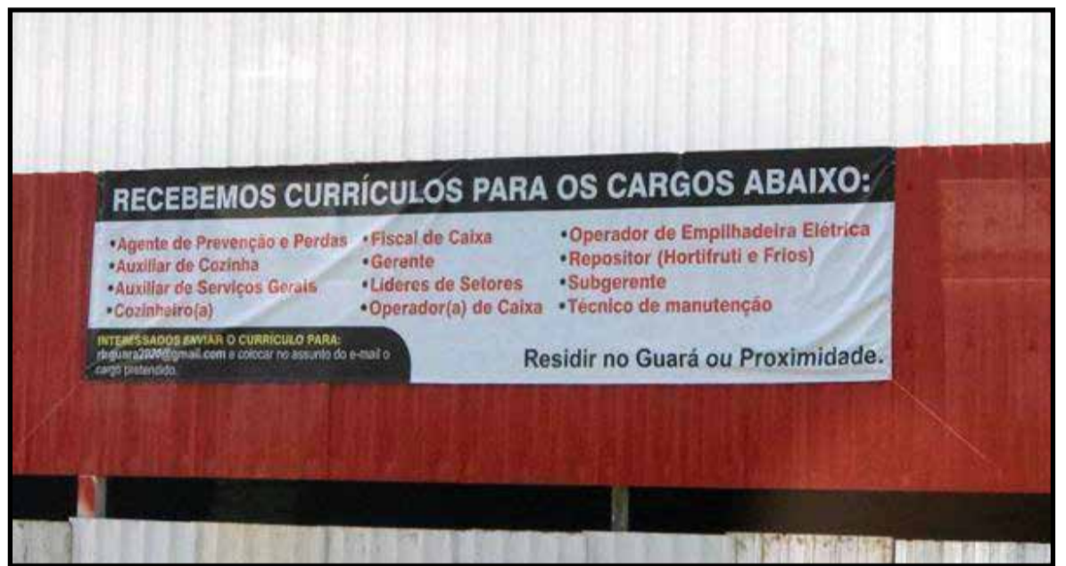
Atacadão Dia a Dia anuncia a oferta de vagas para a loja da QE 13 e de Águas Claras

Segundo grupos de regiões administrativas, a taxa de desemprego diminuiu no Grupo 4 (regiões de baixa renda: Fercal, Itapoã, Paranoá, Recanto das Emas, SCIA/Estrutural e Varjão), passando de 26,6% para 24,9%; e no Grupo 3 (regiões de média-baixa renda: Brazlândia, Ceilândia, Planaltina, Riacho Fundo, Riacho Fundo II, Samambaia, Santa Maria e São Sebastião), de 22,2% para 21%. Essa taxa se manteve re-