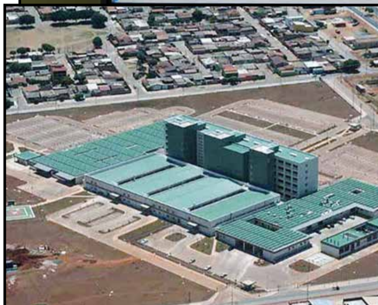
Acima, o projeto apresentado durante a reuni4o com membros do governo e da C4mara Legislativa

da a origem dos recursos, que podem vir de um financiamento do Banco Interamericano de Desenvolvimento (BID) como do Or4amento da Uni4o com a contrapartida do GDF.