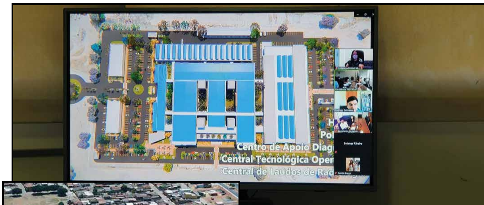
A planta do Hospital de Santa Maria, o mais novo e o mais moderno da rede p4blica do DF, ser4 usada para o projeto do hospital Centro-Sul, por sugest4o do pr4prio governador Ibaneis Rocha.

Embora j4 tenha sido anunciado oficialmente pelo governador Ibaneis Rocha como uma das prioridades do seu governo, n4o est4 definida ain-