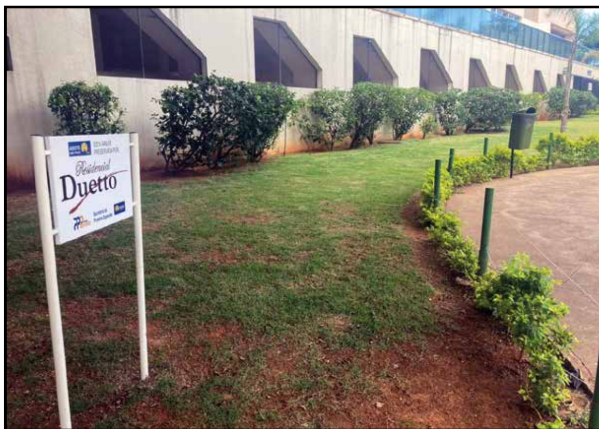
No residencial Duetto, na entrada da Qe 40, a única iniciativa do Adote uma Praça já construído no Guará

As ocupações tradicionais de área pública também estão sob os olhos da fiscalização do