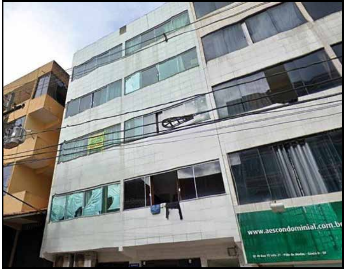
É o arrematante que deverá encarregar-se da desocupação do prédio

Para participar, os interessados precisam se cadastrar no site do leiloeiro e inserir digitalizados os documentos previstos no edital. O credenciamento deverá ser efetuado até dois dias úteis antes da realização dos lances.