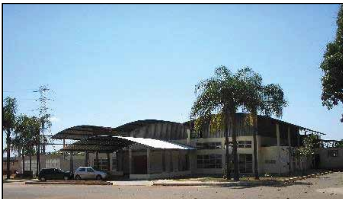
Maior salão de festas da cidade será transformado em escola de idiomas