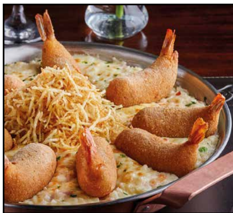
Camarão Coco Bambu

Com o app instalado, na opção cupons, você consegue visualizar uma infinidade de pratos e sobremesas com até 54% de desconto. Para utilizar, basta apresentar o QR code gerado pelo app.