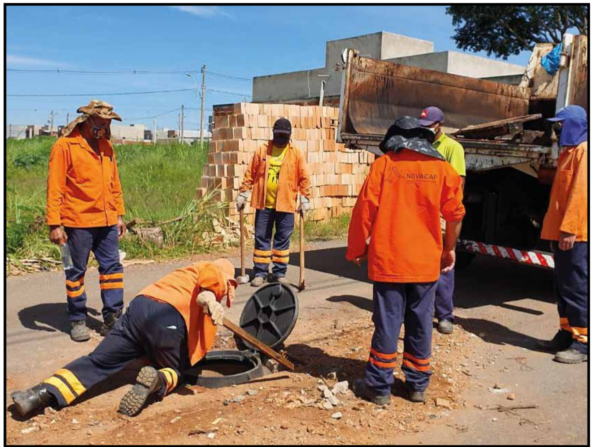
As novas tampas são fixadas de forma a dificultar a retirada pelos ladrões

Além da instalação das novas tampas, a expansão vem recebendo uma operação limpeza. Esta semana, em apenas um dia, juntamente