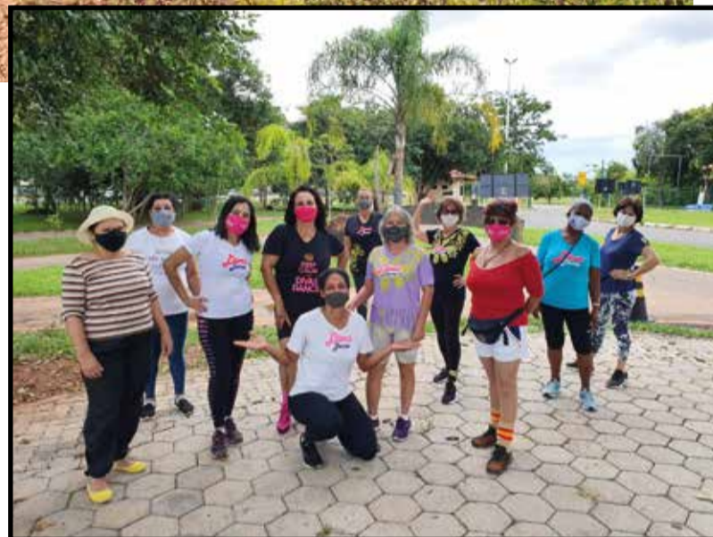
O grupo de dança Divas usa a natureza para seus treinamentos

Com apenas 2,7 hectares, o Parque Dener foi criado para preservar uma nascente e um lago remanescentes da implantação do Polo de Moda e do condomínio Bernardo Sayão, e oferece boas opções para uso, mas o aumento do tráfego e do consumo de drogas dentro de sua área afasta os frequentadores, principalmente à noite, mas pode ser usado com segurança durante o dia. Embora pequeno, o parque oferece uma razoável estrutura, composta por uma pista de caminhada, equipamentos de ginástica e uma