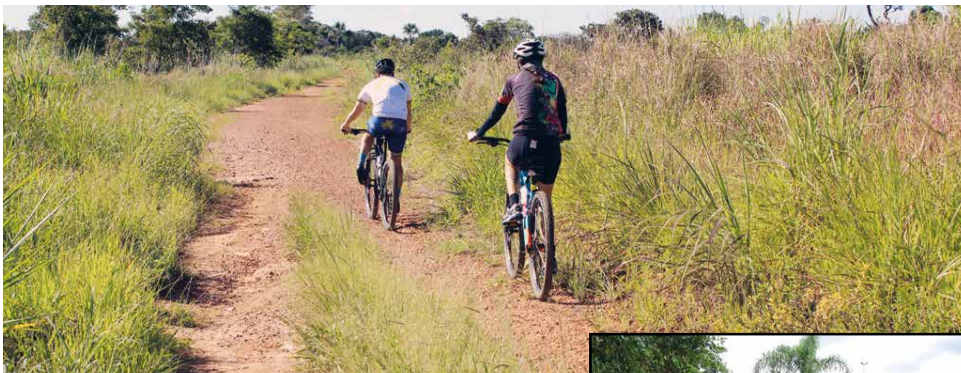
Além da pista com calçamento, o parque oferece uma trilha de chão por entre a natureza bruta