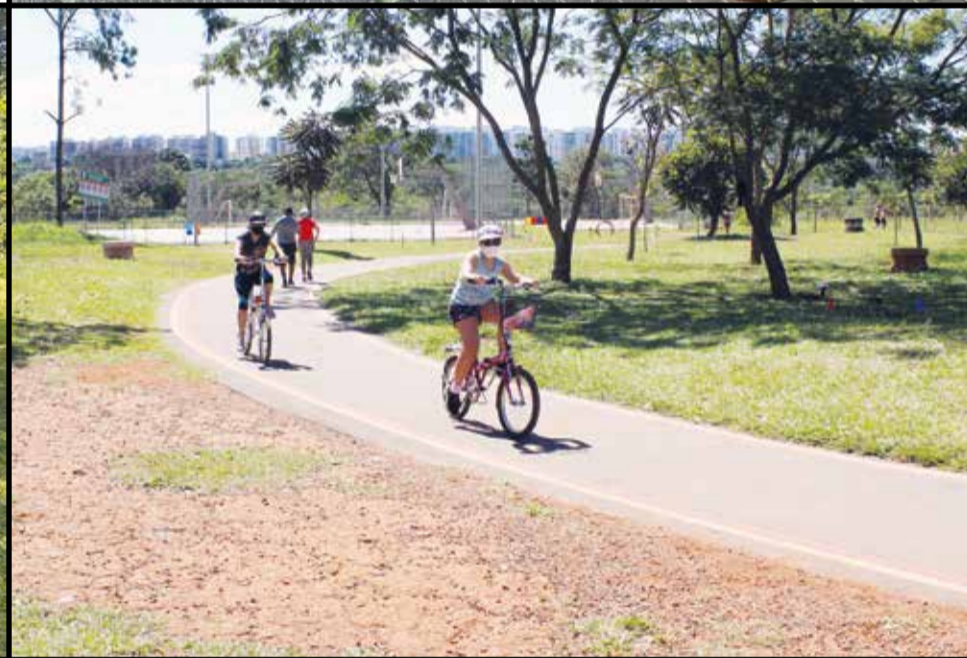
Nos feriados e finais de semana, a frequência chega a 4 mil usuários. Parque oferece opções de atividades para toda a família