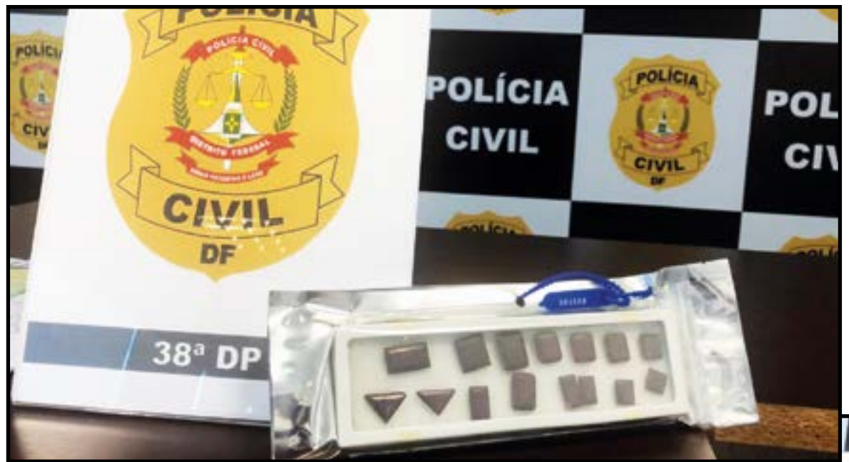
Rubis (acima), documentos e cheques foram apreendidos

Na opera¸o, foram apreendidos diversos documentos,