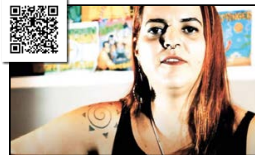
Partidos ao Meio de Lucy

Além disso, organizamos playlists colaborativas, segmentadas por ritmo, nas plataformas de streaming. Assim, os ouvintes e músicos podem adicionar suas músicas preferidas em cada lista. Para adicionar músicas à playlist colaborativa, basta salvá-la nos seus favoritos e usá-la como uma playlist criada por você. Mas, claro, só vale música feita no Distrito Federal, dando preferência, claro, aos artistas do Guará.