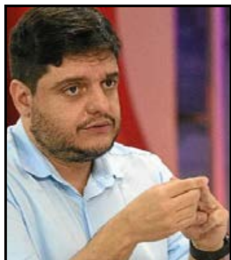
De acordo com Delmasso, as parcerias com as associações de moradores podem agilizar os serviços e manutenção dos espaços públicos

Embora seja motivo de muitas reclamações de moradores nas redes sociais e na Ouvidoria da Administração Regional do Guará, o problema não será resolvido a curto prazo. Talvez no próximo ano. Como não há mais como incluir o serviço no Orçamento do DF