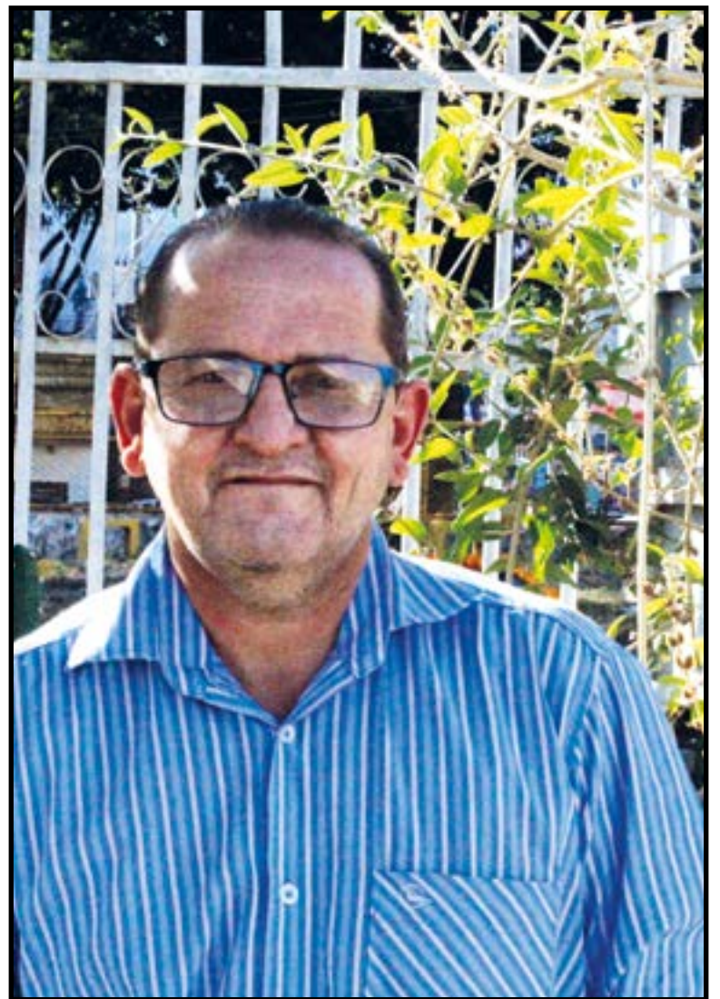
O conselheiro tutelar e vicentino cuida de centenas de famílias guaranaenses

No Guará são dez conferências, ou núcleos, com sete a dez voluntários em cada, que atendem semanalmente 75 famílias, e outras quase 200 quando é preciso. Quando identificam uma família em necessidade, fazem uma análise daquele núcleo familiar. “Procuramos saber qual a real situação da família, tanto financeira quanto afetivamente. Se as crianças estão frequentando a escola, se os adultos estão trabalhando... A partir disso, passamos a oferecer suporte a estas famílias, como cestas básicas, móveis, material escolar, remédio. Checamos se estão inseridas nos benefícios sociais que o governo oferece, e encaminhamos, caso não