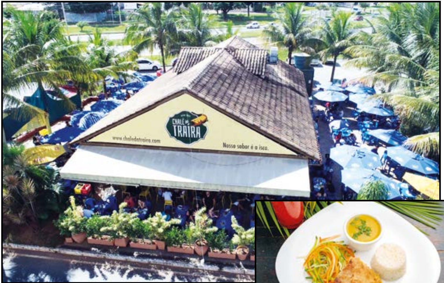
O Chalé da Traíra oferece para o almoço pratos executivos compicanha, carne de sol, parmegianas, filé de peixe, salmão ao molho de mostarda e maracujá e até codorna frita

As mesas afastadas e ao ar livre, aferição de temperatura e a limpeza constante fazem do Chalé da Traíra um ambiente seguro em tempos de afastamento social. O cardápio de drinks e a cerveja sempre bem gelada, além da ampla variedade de petiscos, convida para esticar um pouco depois do almoço, até a happy hour.