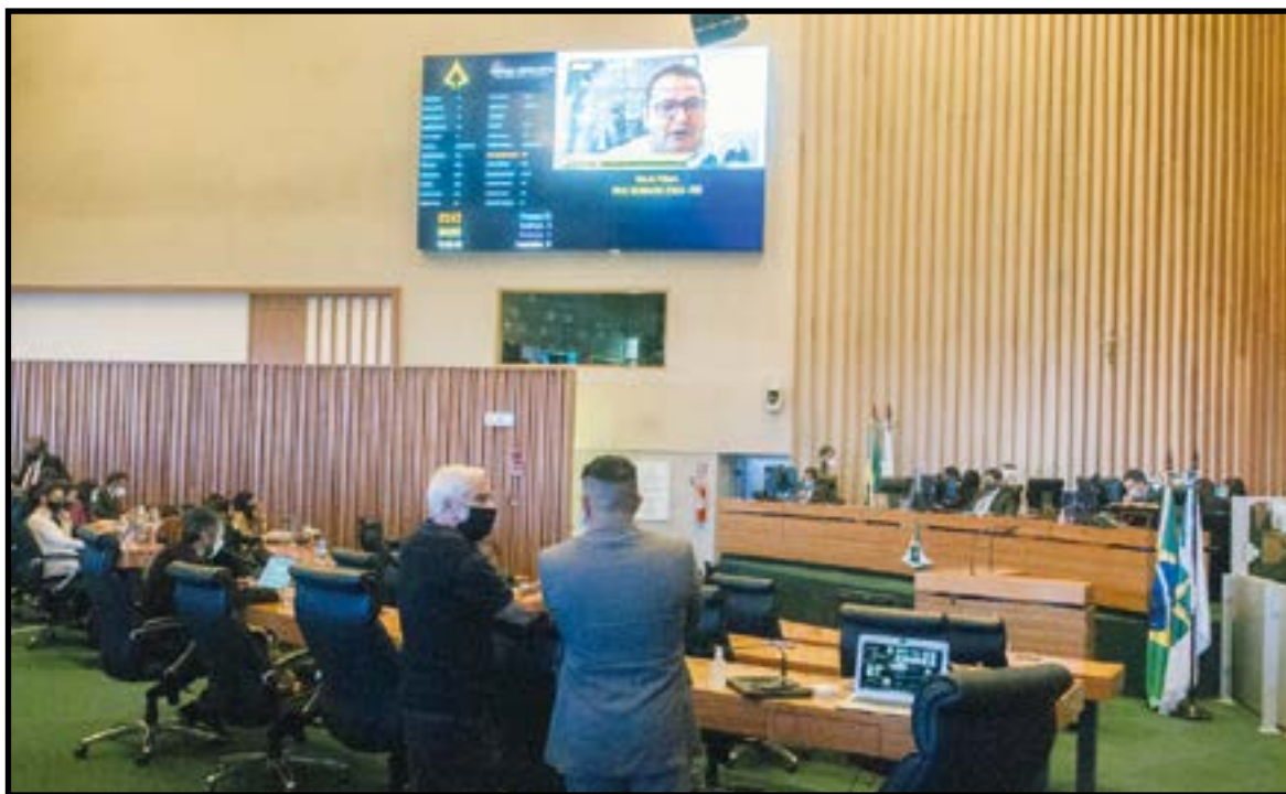
Por causa da pandemia, as reuniões e plenárias são realizadas online, mas as presenciais estão sendo retomadas aos poucos, com os cuidados protocolares

fundiária, meio ambiente, direitos humanos, minorias, direitos dos animais e serviço público também foram matérias de projetos apreciados pela Casa.