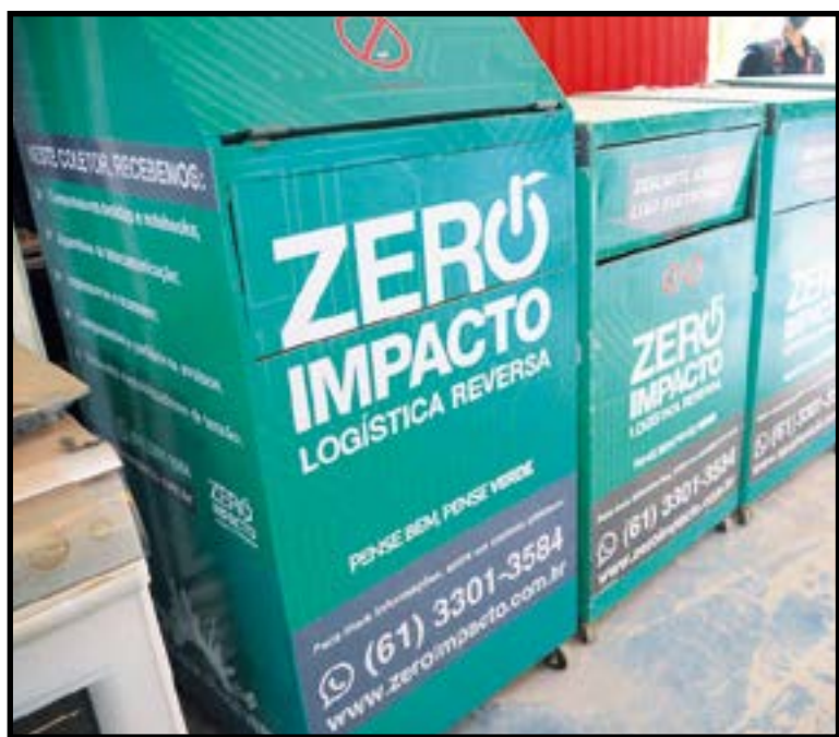
No Guará o ponto fica na Jukaf Confecções na Rua 12 Lote 9 do Polo de Moda

A Secretaria do Meio Ambiente (Sema), a Associação Brasileira de Reciclagem de Eletroeletrônicos e Eletrodomésticos (Abree) e a empresa Zero Impacto Logística Reversa, assinaram um acordo de cooperação para reciclagem de eletroeletrônicos – categoria que inclui os eletrodomésticos.