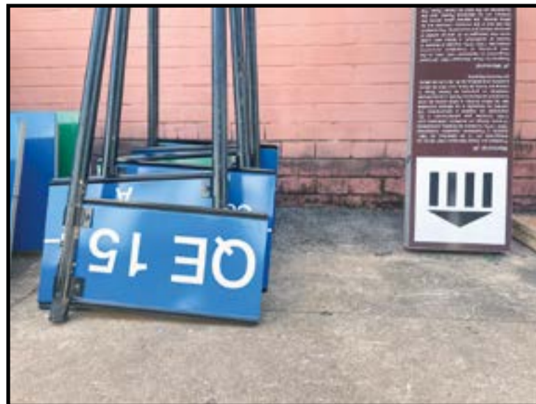
O DER produz as placas numa fábrica em Sobradinho, onde estão sendo confeccionadas as placas da QE 15

comunitários, cooperativas habitacionais e outras instituições organizadas vão poder cuidar da manutenção de quadras, praças e equipamentos públicos com recursos destinados pelo governo. O projeto tem o objetivo, segundo o autor, de desburocratizar e agilizar a contratação de serviços que exigem menos recursos financeiros e não passem a depender mais da lenta burocracia da máquina pública.