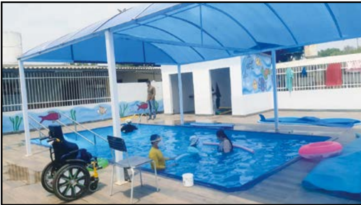
Todas as instalações foram melhoradas durante o período da pandemia

determinado porque sentem a necessidade desse espaço para a socialização deles”, afirma a diretora, que defende a criação de um espaço público, fora do CEE 1, para o acolhimento dessa faixa de idade de alunos especiais. Ela conta que muitos pais a procuraram durante a pandemia em busca de ajuda, porque seus filhos sentiam falta do ambiente escolar e não entendiam porque não poderiam continuar frequentando a escola.