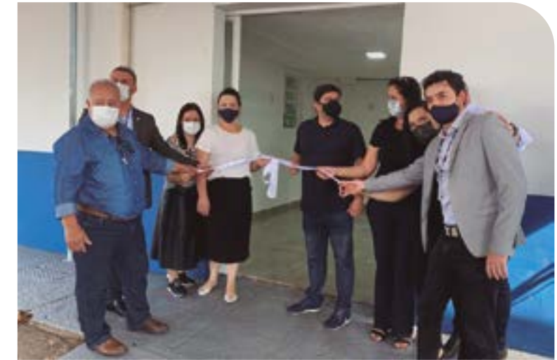
A reinauguração contou com a presença de autoridades da Secretaria de Saúde, membros do Conselho de Saúde do DF e o deputado distrital Rodrigo Delmasso (Republicanos), autor de emenda que bancou a maior parte da reforma

O processo de revitalização durou 6 meses e durante todo esse período não houve interrupção dos serviços à comunidade. Foram mantidos os atendimentos agendados e a demanda espontânea. A manutenção foi dividida em três etapas: a primeira foi intervenção no telhado, com correção