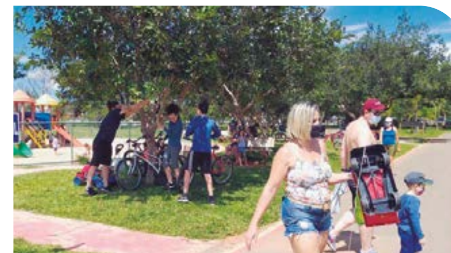
Parque oferece opções de esporte e recreação para todas as idades