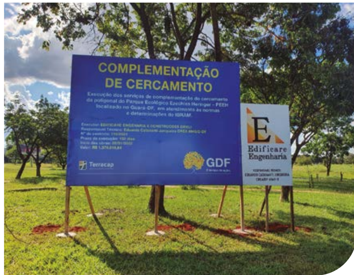
De acordo com o contrato, as obras deverão ser concluídas em até cinco meses