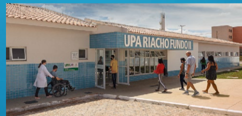
UPA do Riacho Fundo II