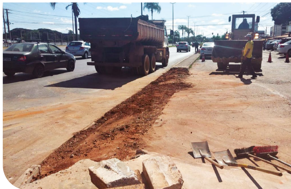
No final de cada trecho as calçadas foram construídas dos dois lados. A reabertura do acesso ao comércio da QI 23 é o primeiro resultado prático da reunião com os moradores

pela falta de divulgação do que estava sendo feito, e depois foi aumentando à medida em que as intervenções foram retirando mais espaço da via. A maior parte da preocupação dos moradores é em relação ao aumento da população do Guará II na proporção inversa à retirada do espaço de circulação de veículos, o que pode aumentar os pontos de estrangulamento na via central quando as novas projeções residenciais já vendidas pela Terracap estiverem todas ocupadas – a previsão é de mais 30 mil novos moradores às margens da via central nos próximos dez anos.