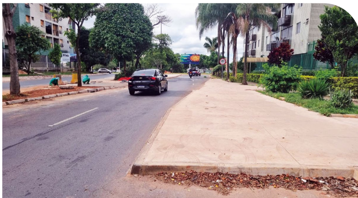
As interferências no trânsito foram muito drásticas, com a redução de até uma faixa e meio em alguns trechos da via central