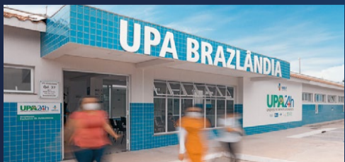
UPA de Brazlândia