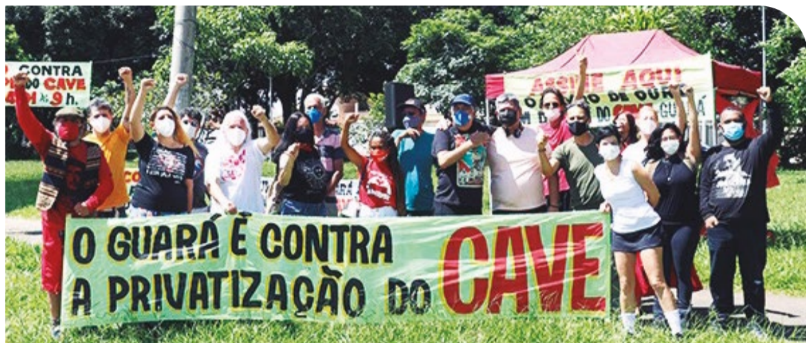
O movimento cultural alega que a inclusão do teatro de arena na privatização é ilegal

O mais provável é que licitação seja adiada até a decisão do plenário do Tribunal, mesmo que a decisão seja favorável ao governo. Mas, se os conselheiros optarem pela