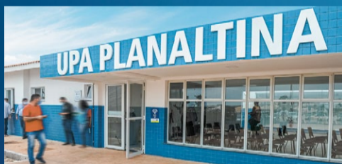
UPA de Planaltina