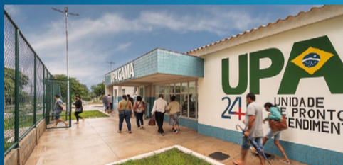
UPA do Gama