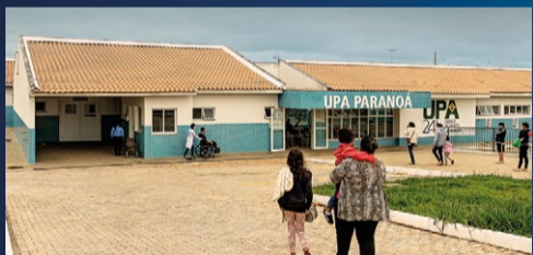
UPA do Paranoá

Pouco a pouco, o GDF melhora a saúde do DF.