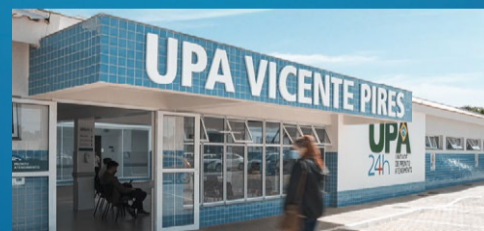
UPA de Vicente Pires