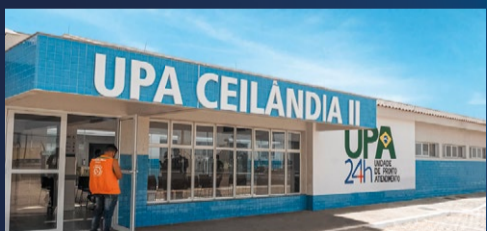
UPA da Ceilândia