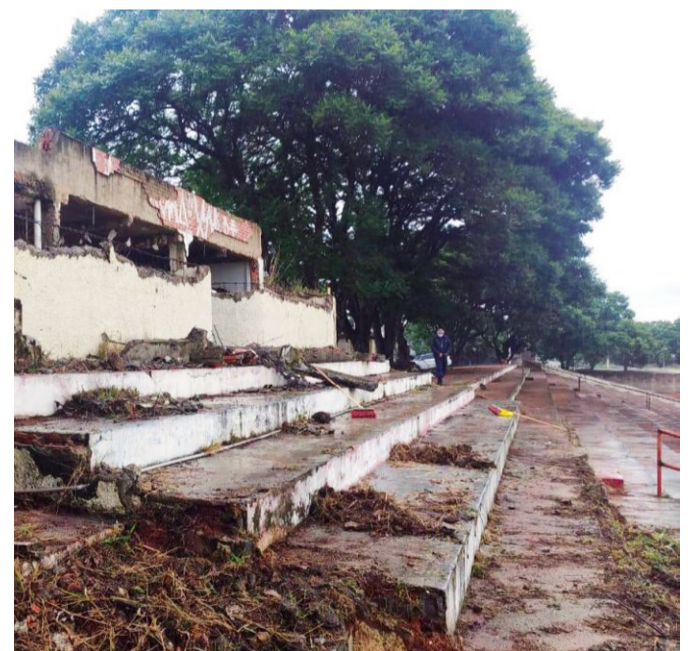
Além de ter que construir um novo ginásio coberto, o investidor terá que reconstruir o estádio do Cave

um maluco que não se preocupe em recuperar o que investir ou tenha outras intenções”, reafirma o investidor, que foi o responsável pela elaboração do novo projeto do Cave, através de Proposta de Manifestação de Interesse (PMI) em 2015.