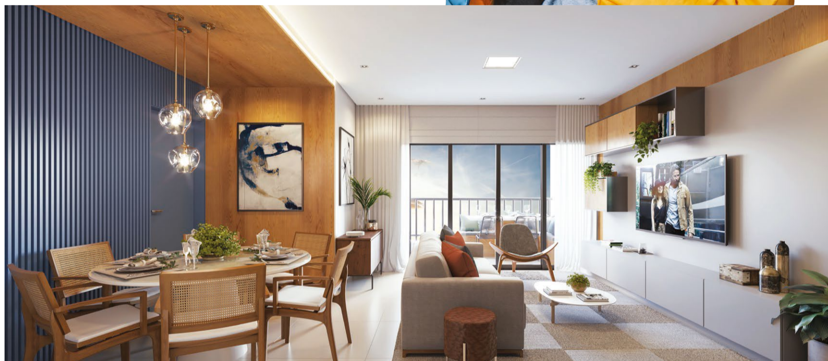
4º Ofício R.2-M104.188