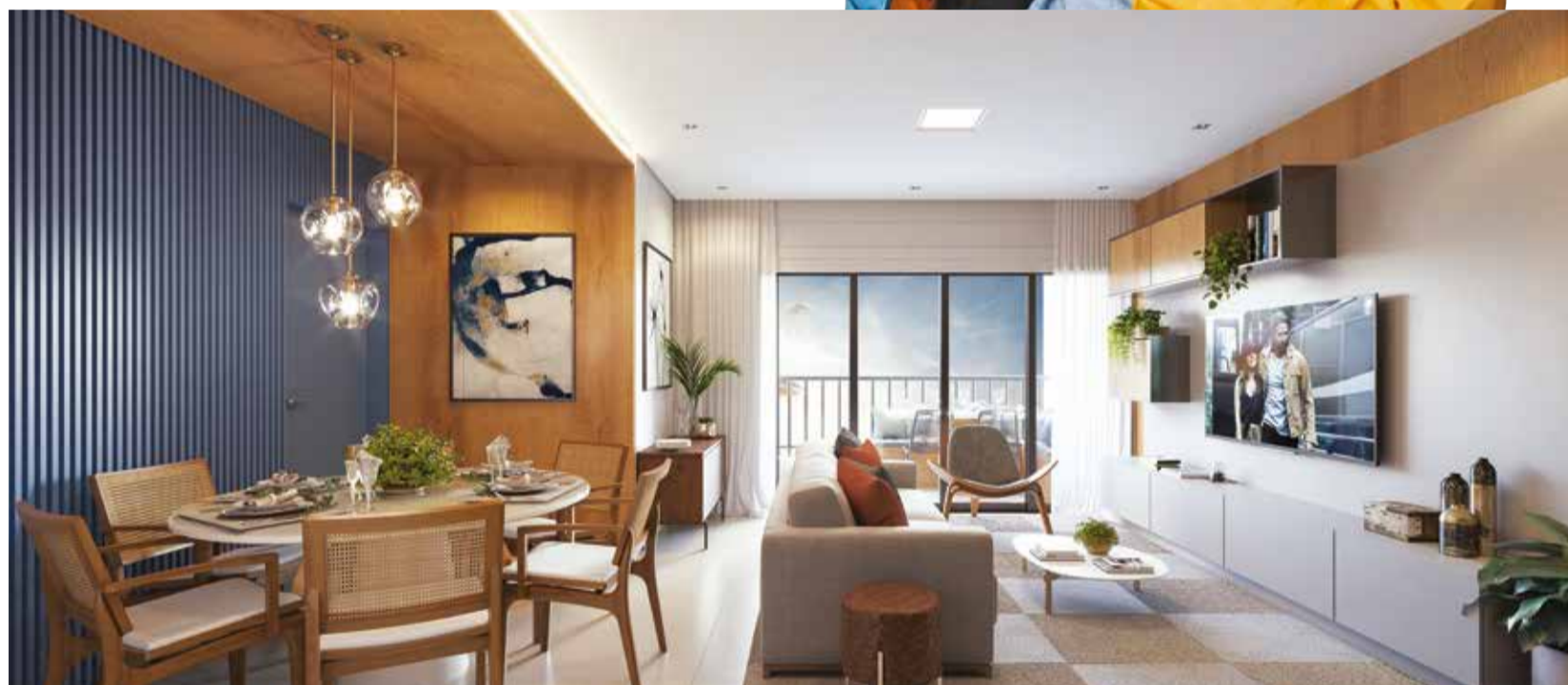
4º Ofício R.2-M104.188