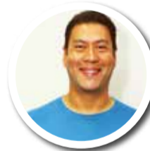
JAPA DA BIKE (PSD)