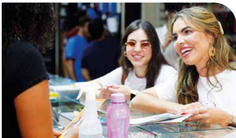
Paula Belmonte decidiu trocar a Câmara federal pela Câmara Legislativa para estar mais próxima da população do DF

Empresária, administradora e mãe de seis filhos; Eleita melhor parlamentar do Distrito Federal pela organização Ranking dos Políticos; Parlamentar mais econômica de todo o Congresso Nacional; Abriu mão de todos os privilégios políticos como aposentadoria e plano de saúde especiais e auxílio-moradia.