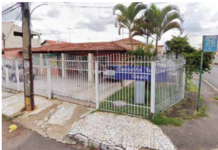
Conselho Tutelar do Guarará funciona numa acasa alugada na QE 26

O Atendimento presencial também é feito no endereço pode ocorrer a denúncia de maus tratos ou de conflito.