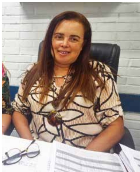
O CEF 10 do Guará tem se destacada nos últimos anos na cidade, e agora vai receber quase 200 novos alunos