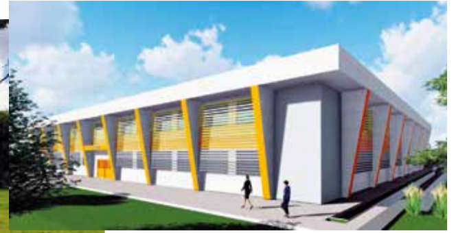
Novo complexo educacional será construído em um terreno do GDF de 60 mil metros quadrados na QE 23 do Guará II, atrás da Unidade Básica de Saúde (UBS) 2. Obra custará R$38 milhões e será licitada este ano