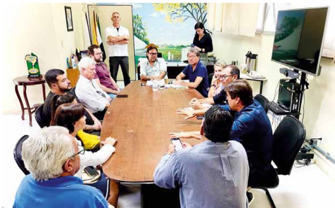
Reunião do administrador e representantes discutiram as melhorias.