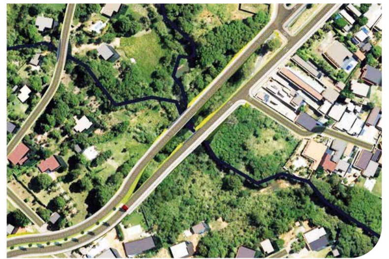
Projeto prevê a duplicação da parte ainda não duplicada, entre a QE 38 do Guará II e o Lar dos Velinhos

A duplicação começou a ser planejada no último dos três governos de Joaquim Roriz, mas ficou parada no governo Cristovam Buarque. O projeto voltou a andar no governo Arruda, quando o Distrito Federal recebeu a maior quantidade de investimentos em obras de sua histó-