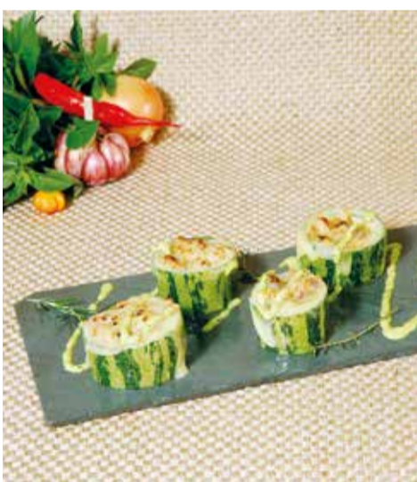
Que Abobrinha é Essa? Abobrinha com costelinha defumada

Ceará Carne de Sol é um dos favoritos já que acumula prêmios no concurso ao longo dos anos