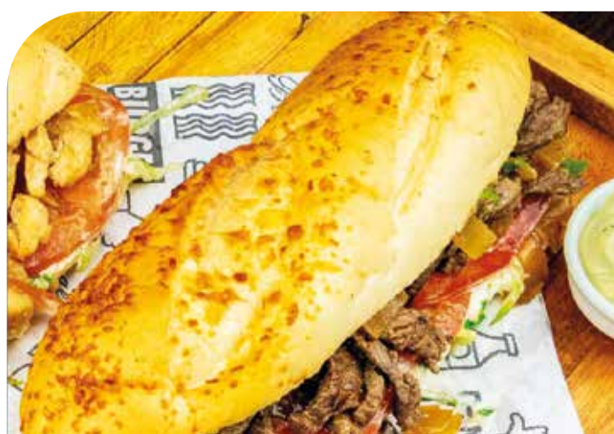
As baguetes são a especialidade da casa