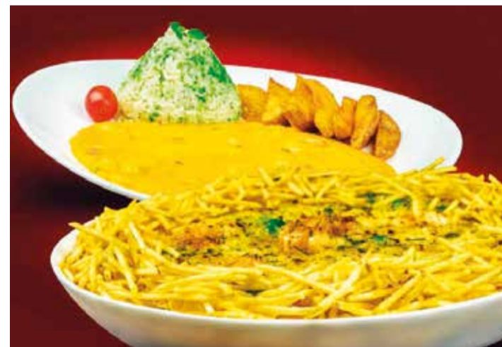
Uma versão do camarão internacional do Coco Bambu ficou mais saudável