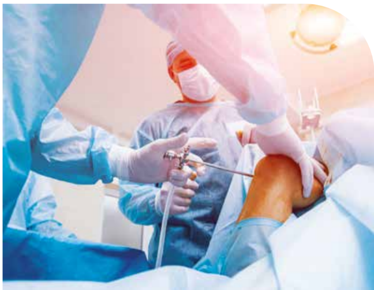
Hospital especializado em ortopedia terá mais de 200 leitos

E os serviços de emergência de pronto-socorro para os guaraenses serão atendidos pela UPA, que será construída na QI 23 do Guará II, em frente à Estação Guará do Metrô, com início de obras previsto para os próximos meses e entrega até o primeiro semestre de 2024.