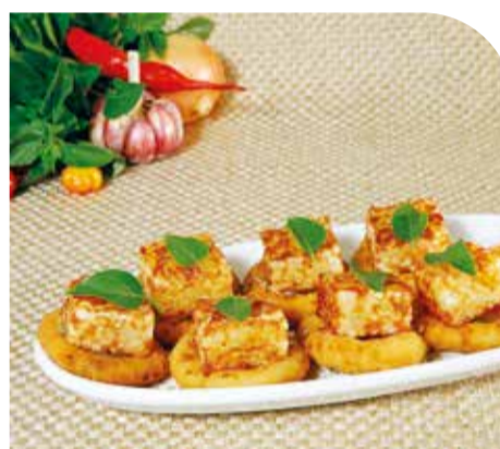
Dadinhos da Neta da Jô 7 dadinhos de tapioca, devidamente acomodados sobre 7 anéis de cebola empanadas, servidos com uma deliciosa geleia agridoce de pimenta, e pequenas folhas de manjeriço sobre os dadinhos para finalização.