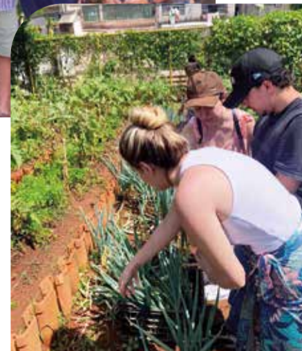
À esquerda os alunos da FGV ajudando na colheita