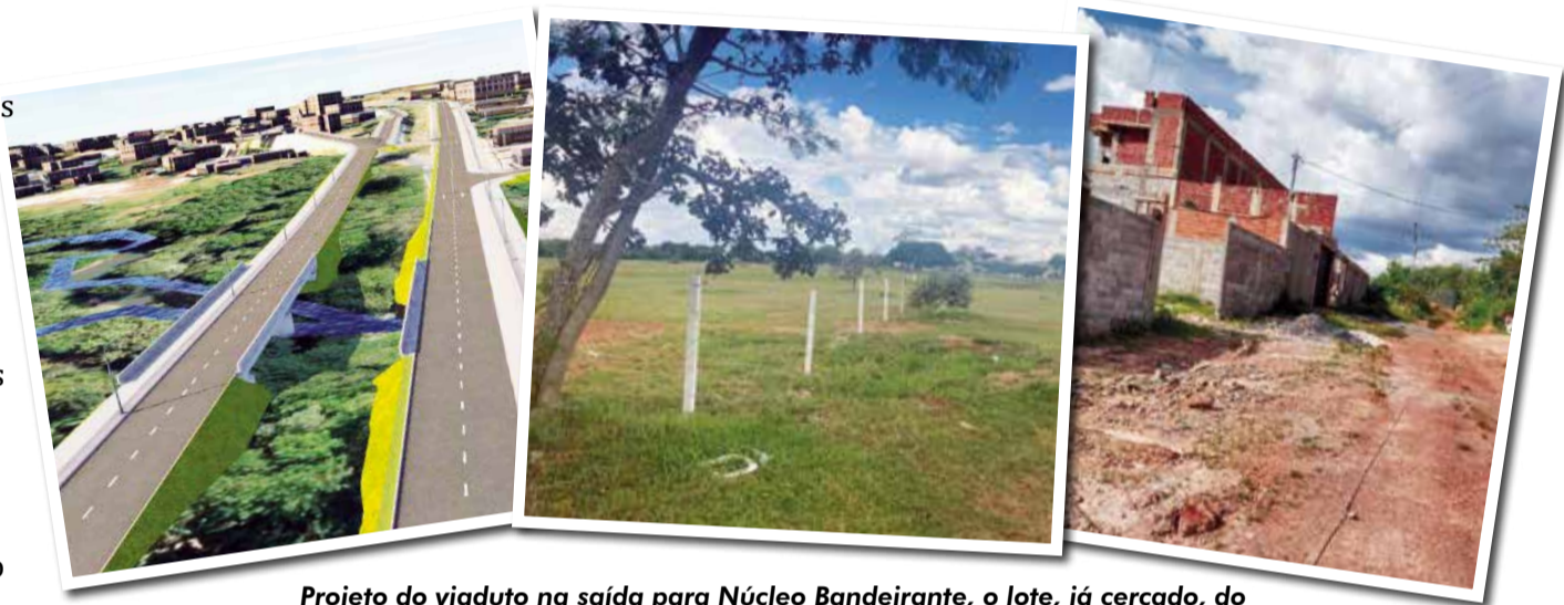
Projeto do viaduto na saída para Núcleo Bandeirante, o lote, já cercado, do futuro hospital e as novas quadras do Guará já recebendo melhorias