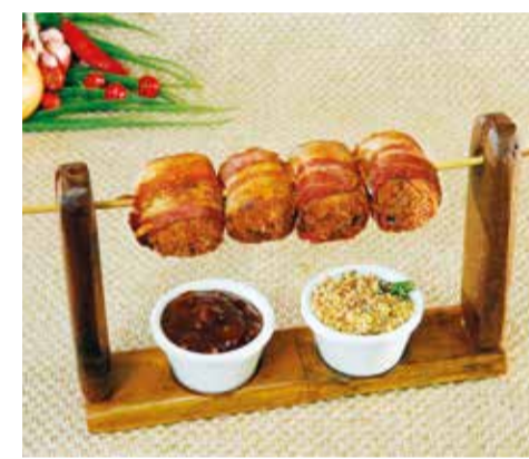
Porco no Rolete Almôndega de carne suína, envolvida no bacon, recheada com parmesão, empanada na farinha panko. Acompanha molho da casa e farofa de lombo suíno com abacaxi