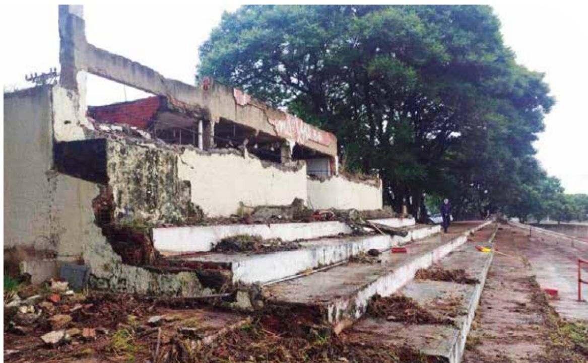
A criação de um lote próprio faz facilitar a privatização e recuperação do estádio do Cave