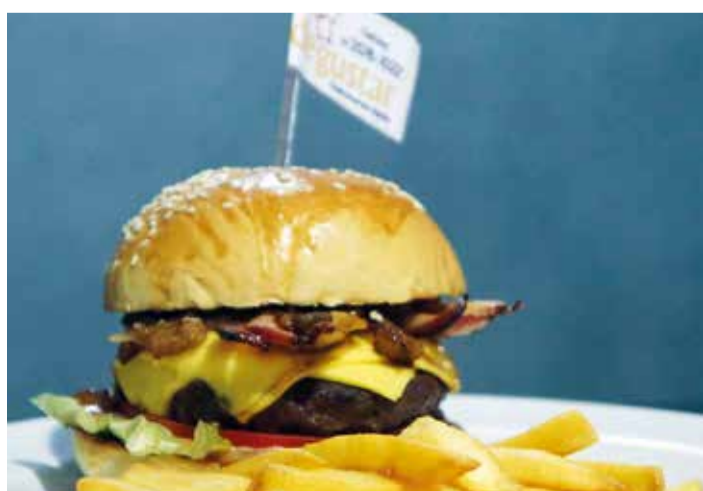
Os recheios dos sanduiches são preparados na hora