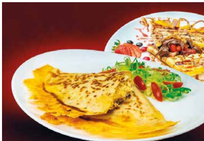
Casa oferece crepes salgados e doces de vários sabores