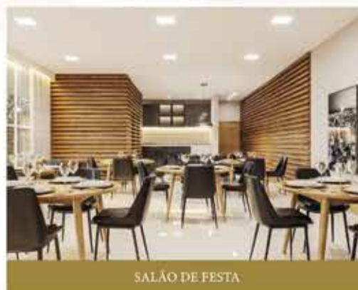
SALÃO DE FESTA