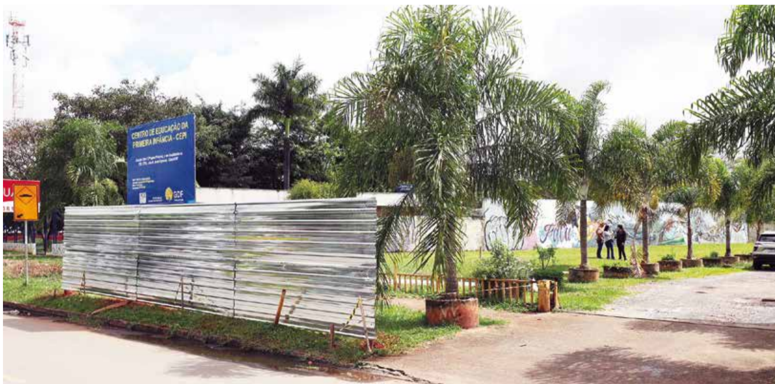
Creche será construída entre as QEs 17 e 19, ao lado do Centrão. Terreno já está sendo cercado

Segundo a secretária de Educação, Hέλvia Paranaguá, o governo pretende construir