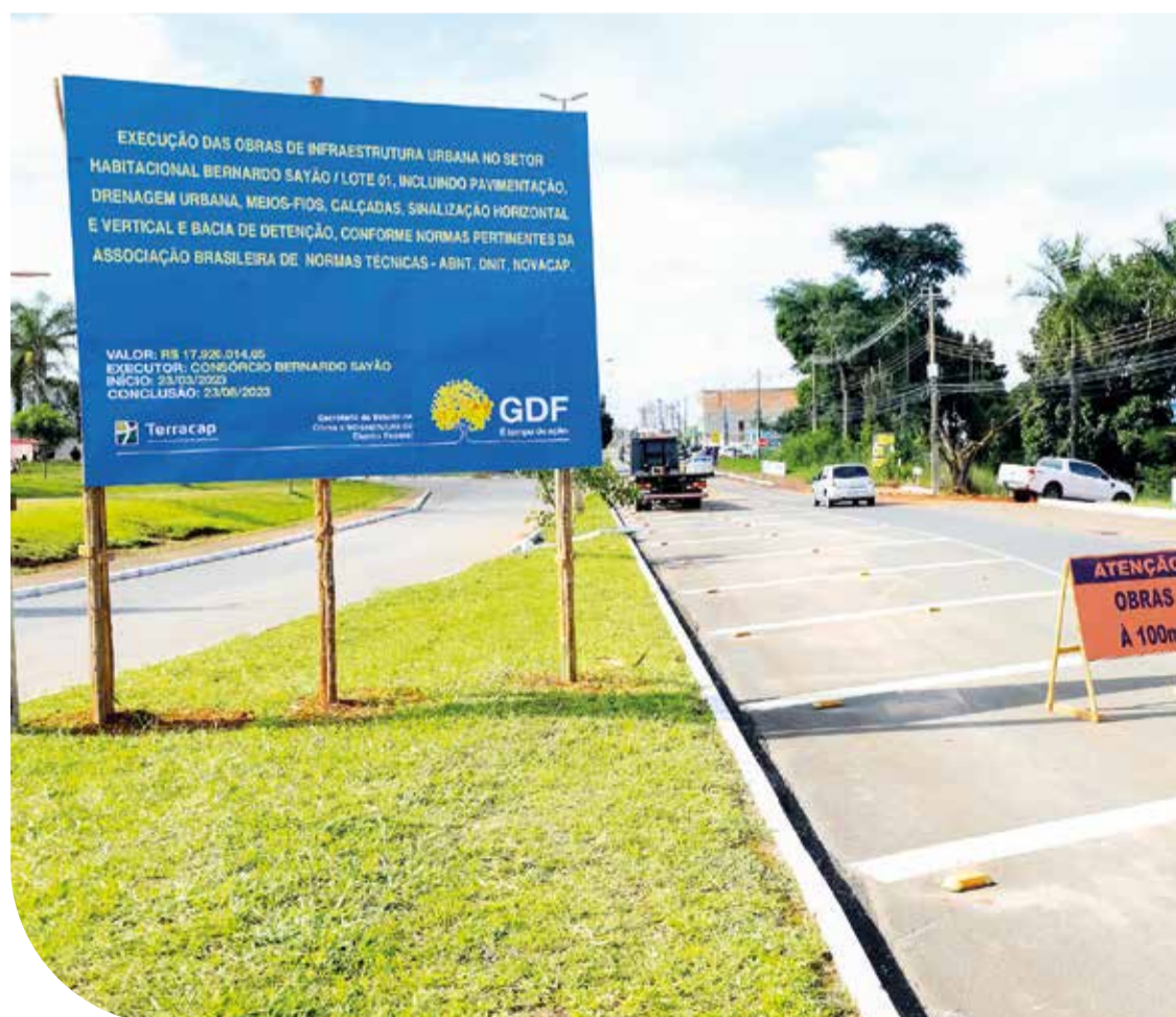
As obras começam nos próximos dias