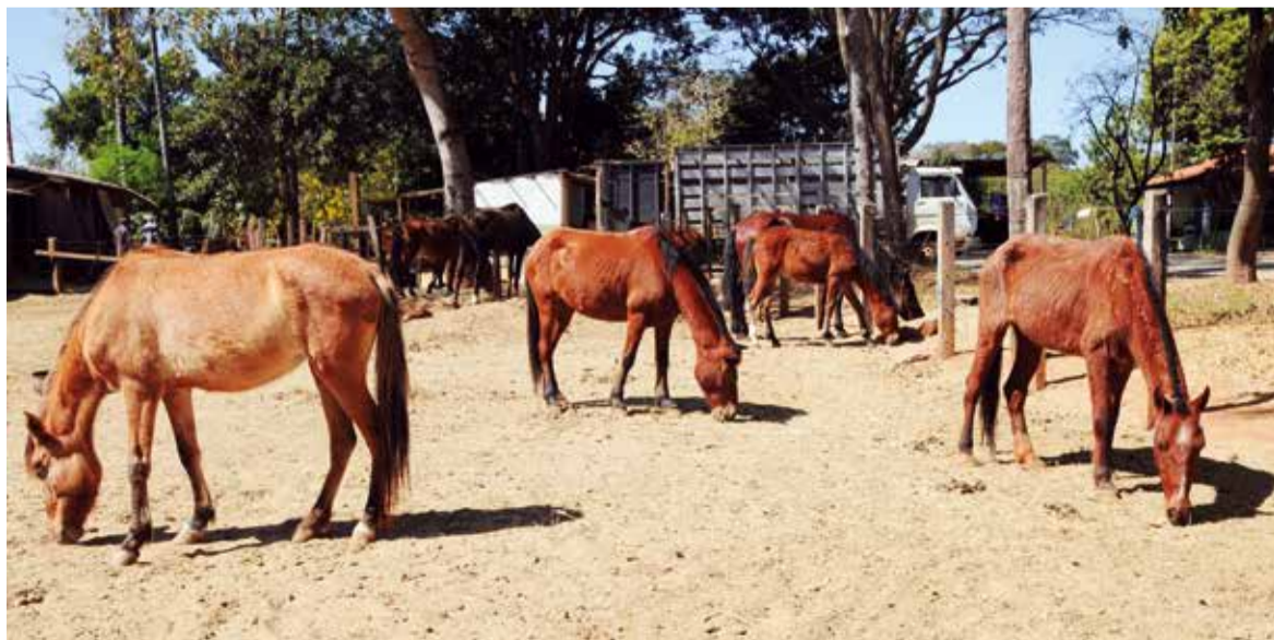
Cavalos no curral da Seagri: quando se identificam maus-tratos, animais são recolhidos para tratamento

Caso você identifique situações de maus-tratos ou cavalos abandonados, acione a Central de Atendimento do GDF pelo telefone 162. O canal funciona de segunda a sexta-feira, das 7h às 21h. Aos sábados, domingos e feriados, o atendimento vai das 8h às 18h.