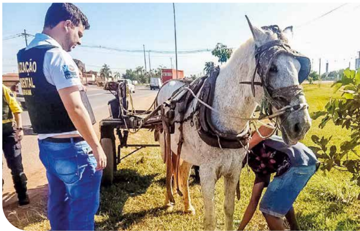
Fiscalização fecha o cerco aos maus tratos aos animais

Segundo ele, a pasta tem promovido reuniões com os líderes dos carroceiros e entrado em contato com os tra-