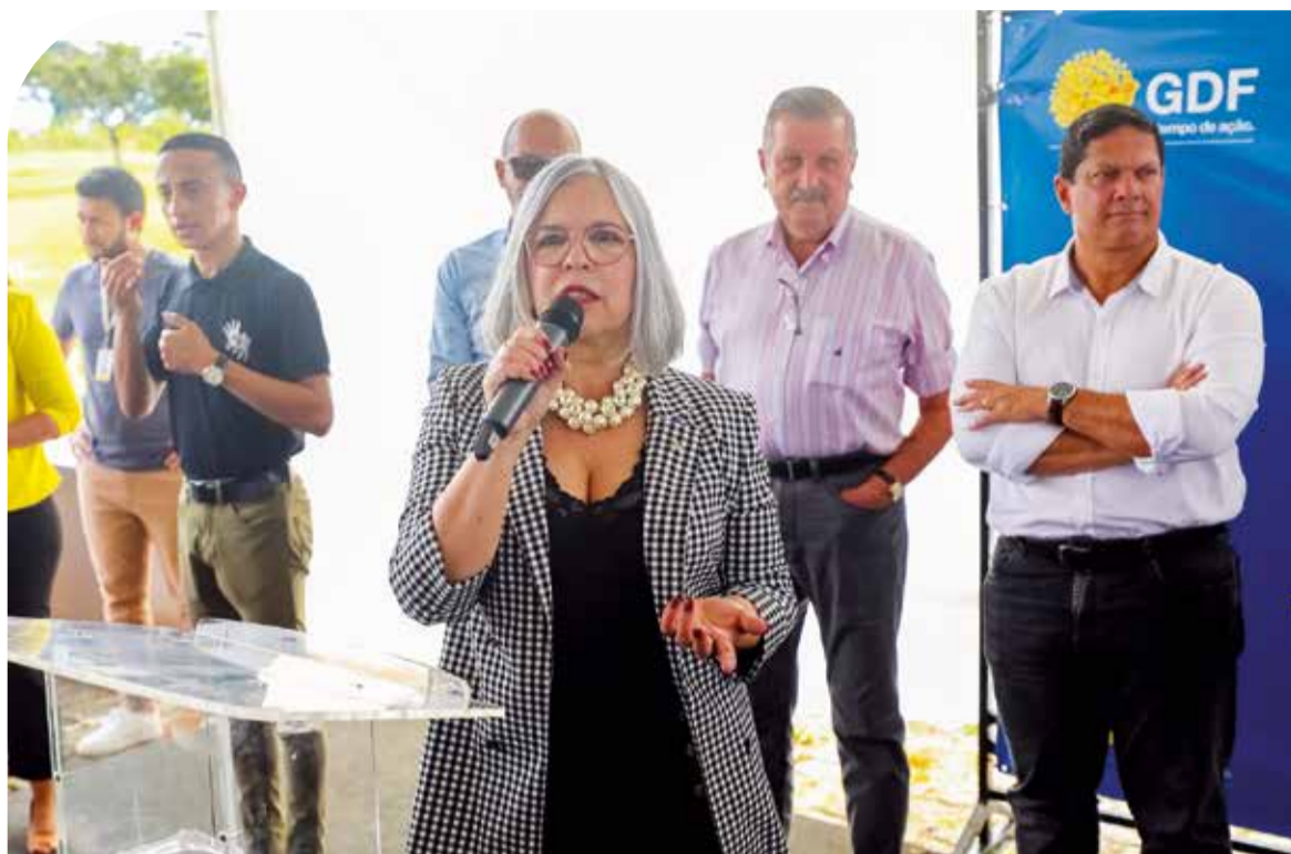
Secretária de Educação Hélvia Paranaguá, anunciou também o Complexo Escolar do Guará

até 40 creches até 2026. Caminho que vem sendo percorrido e é comemorado a cada lançamento de obra por atacar justamente um dos maiores gargalos da rede pública.