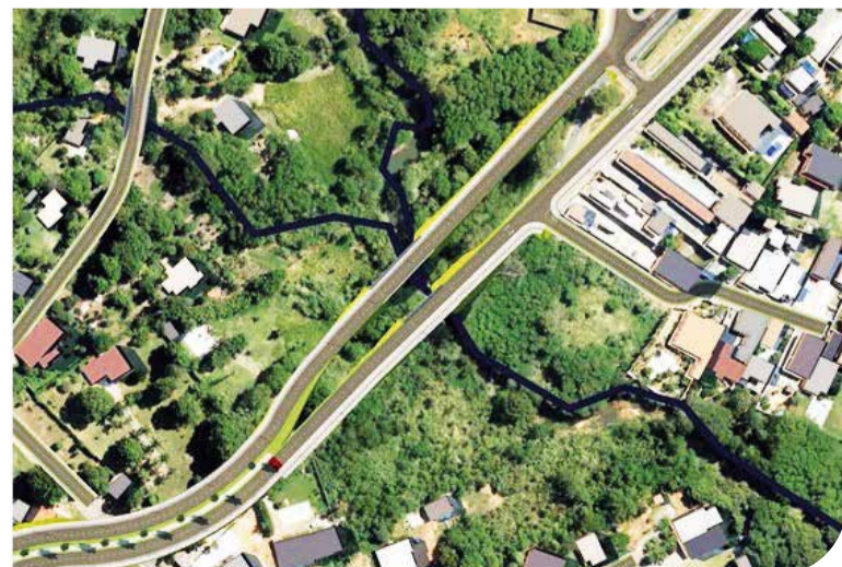
Projeto prevê a duplicação da parte ainda não duplicada, entre a QE 38 do Guará II e o Lar dos Velinhos