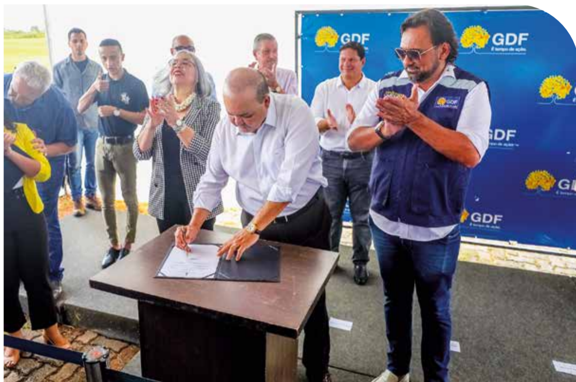
Governador Ibaneis assina ordem de serviço para construção da creche

deirante (ver reportagem nas páginas 6 e 7). E na semana passada, foi anunciada oficialmente a construção do Hospital Ortopédico da Região Centro-Sul, que começará a ser erguido entre a Unidade Básica de Saúde 02, ao lado das QEs 17 e 19 do Guará II, com capacidade para 200 leitos, e a construção da Unidade Básica de Saúde (UPA), na QI 23 do Guará II. Ainda durante a solenidade nesta quarta-feira, Ibaneis anunciou para o segundo semestre o lançamento do Complexo Educacional do Guará, que estava previsto desde o início do primeiro governo, em 2020, com recursos já destinados pelo Fundo Nacional do Desenvolvimento da Educação (FNDE). Além de quatro escolas públicas e o Centro Interescolar de Línguas (Cilg), o complexo vai abrigar também a Coordenação Regional de Ensino do Guará, que funciona precariamente na QE 38.