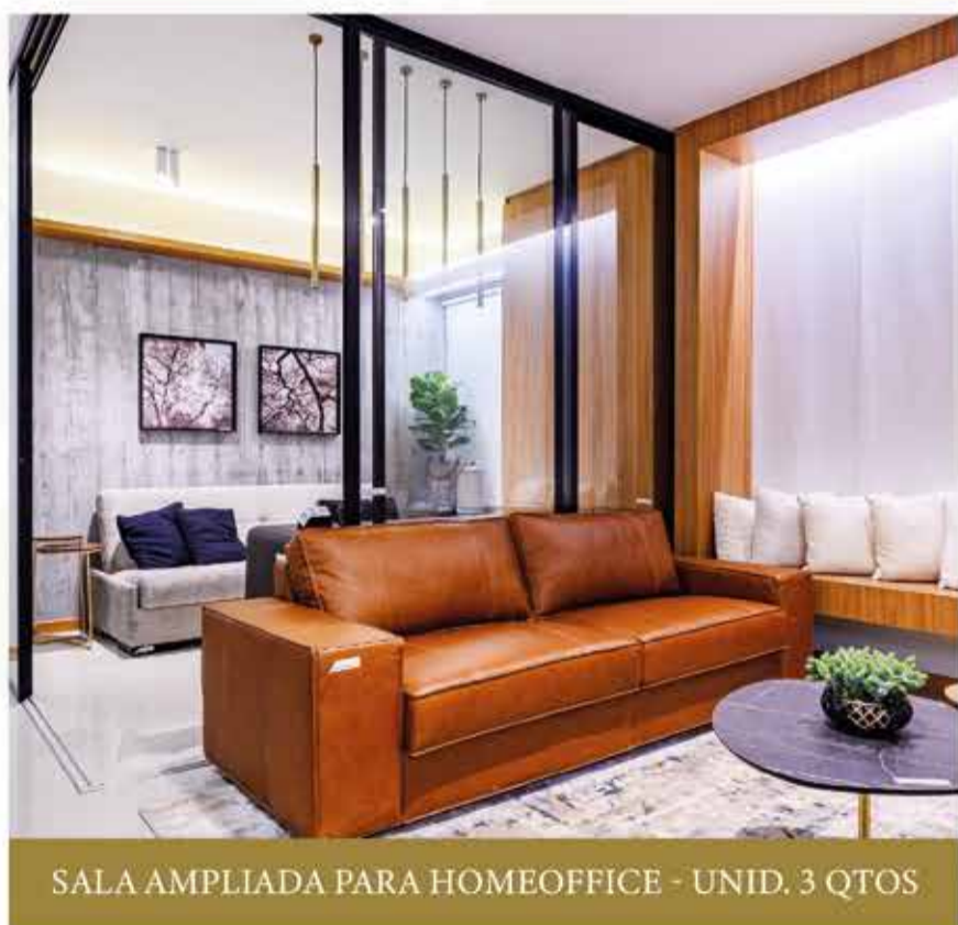
SALA AMPLIADA PARA HOME OFFICE - UNID. 3 QTOS