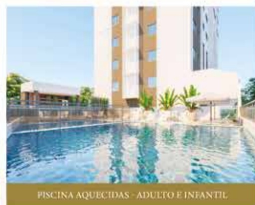
PISCINA AQUECIDAS - ADULTO E INFANTIL