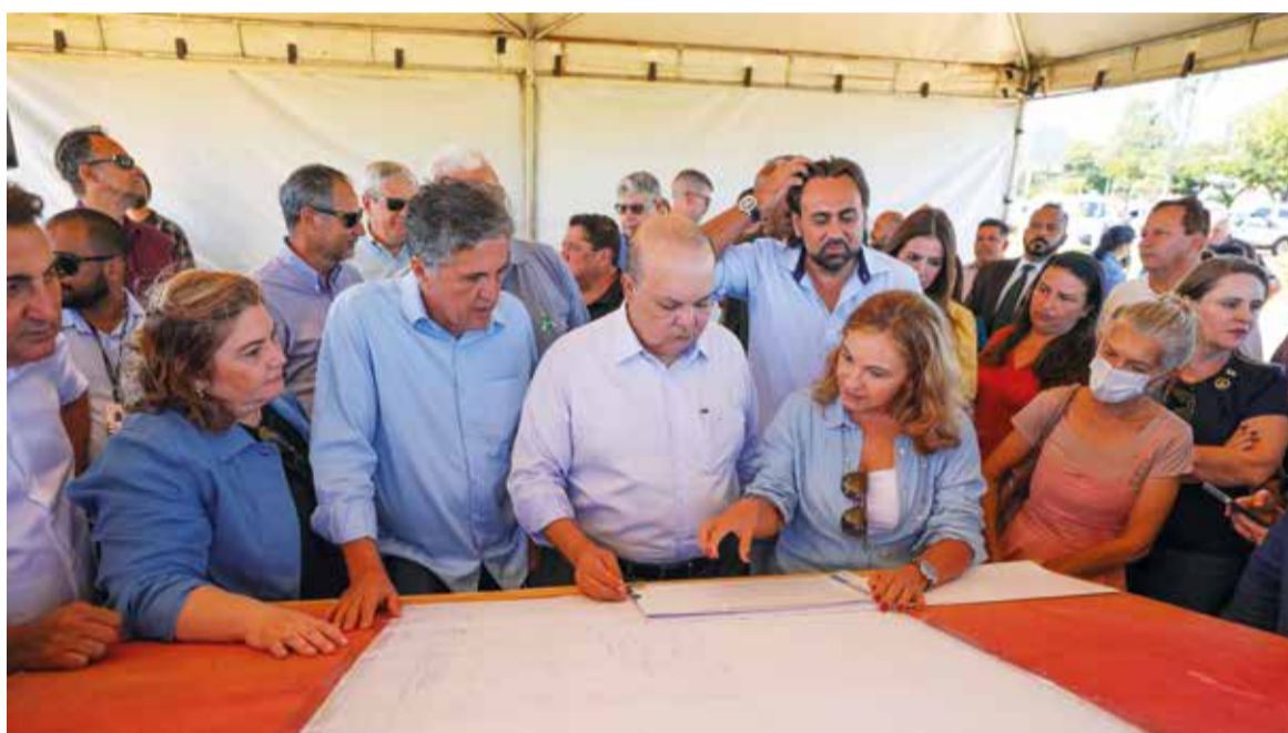
Governador conhece detalhes do projeto, junto com a secretária de Saúde

O hospital terá perfil de assistência em ortopedia, com atendimentos nas áreas de coluna, ombro, braço, cotovelo, mão, quadril, perna, joelho,