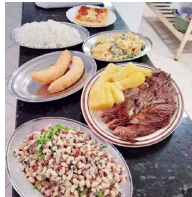
Picanha fatiada, com arroz, feijão tropeiro, uma das estrelas da casa