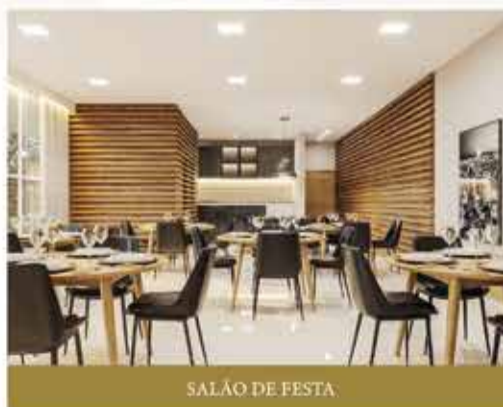
SALÃO DE FESTA