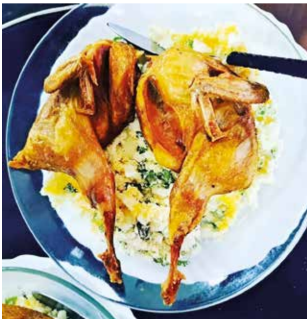
Codorna frita com farofa de ovos, símbolo da casa