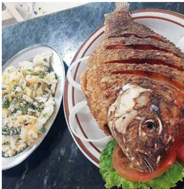
A tilápia inteira é um dos pratos mais pedidos