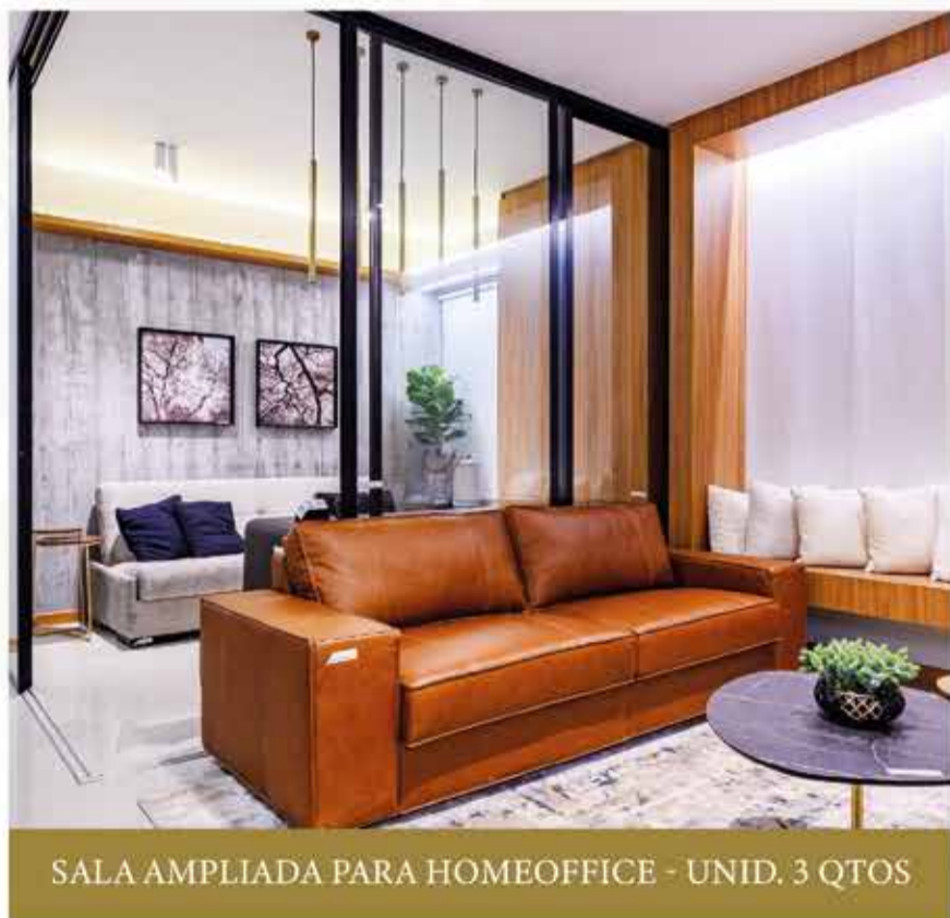
SALA AMPLIADA PARA HOME OFFICE - UNID. 3 QTOS