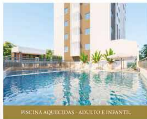
PISCINA AQUECIDAS - ADULTO E INFANTIL