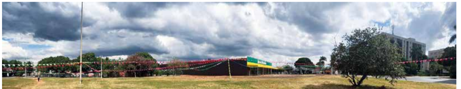
No topo da página, a área da QI 33, ou Centro Comunal II, com lotes já vendidos. Acima, o Centro Comunal I, onde está a loja Casa Brasileira (a área restante é destinada a uma praça) e na página ao lado a Praça da Moda, ocupada por quiosques

O Centro Comunal I, onde está a 4ª Delegacia de Polícia, por exemplo, onde é realizado o Grande São João do Guarará e onde aportam circos mambembes, está sendo ocupado por um complexo ligado