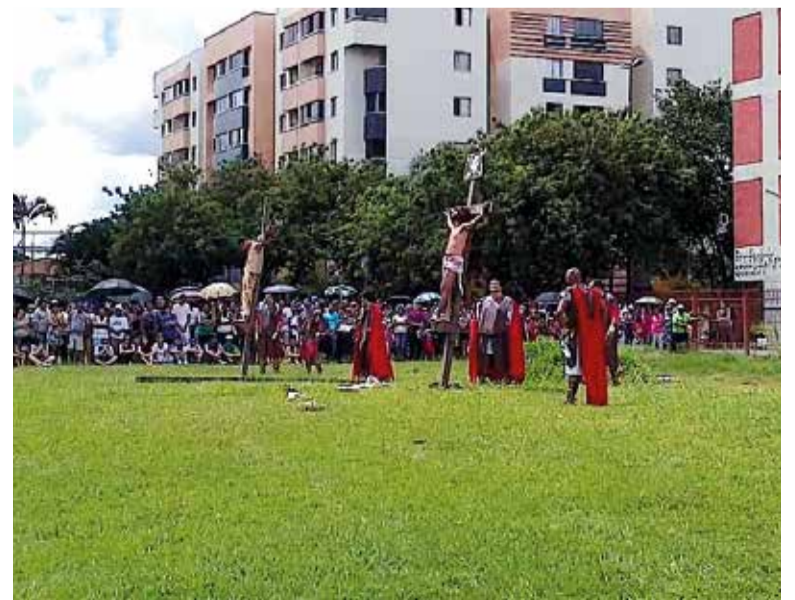
As festas juninas, a encenação da Via Sacra e outros eventos podem não ter onde serem realizados no Guarará