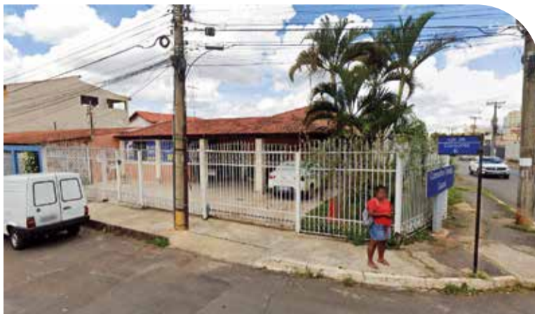
Um dos desafios da próxima gestão do Conselho Tutelar do Guarará é a construção de uma nova sede, atualmente na QE 26

Para votar, basta o morador apresentar o título eleitoral em situação regular (que tenha votado ou justificado ausência na última eleição no DF). O eleitor poderá votar