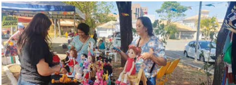
Feirarte da Amizade leva artesanato, esporte, foodtrucks, brincadeiras e música no sábado