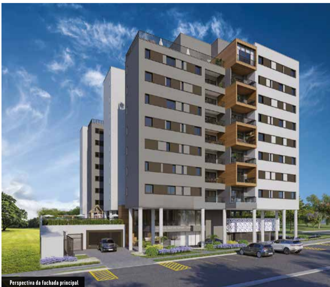
Perspectiva da fachada principal