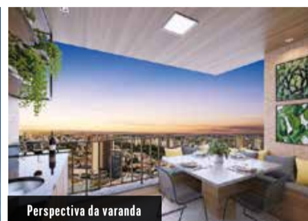
Perspectiva da varanda