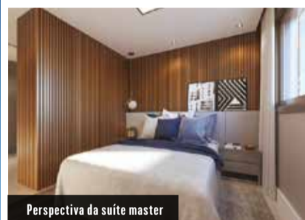
Perspectiva da suíte master