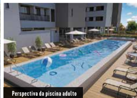
Perspectiva da piscina adulta