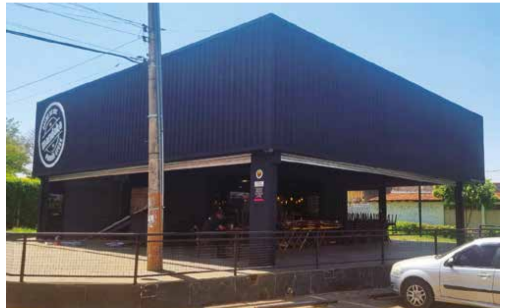
Desde julho, esta construção em um lote da Terracap invadido nas quadras novas e este quiosque de alimentação sem alvará desafiam a fiscalização