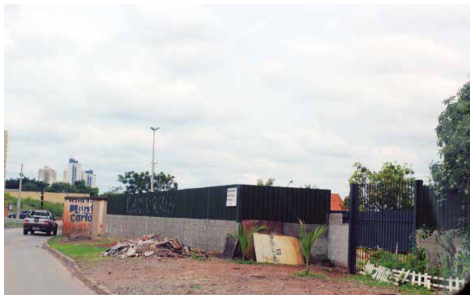
Ocupação das margens da linha férrea colocam em risco inclusive as locomotivas, mas ninguém impede que elas continuem. Outras invasões permanecem intactas

cil apontarmos uma pessoa para dar entrevista. É possível que vocês queiram fazer uma pergunta de fiscalização de obras, depois sobre comércios e a fonte só poderia responder sobre um dos dois temas.