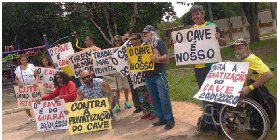
A luta do movimento cultural demorou cerca de 20 meses para conseguir retirar o Teatro de Arena da concessão

Uma audiência pública promovida pela Secretaria de Desenvolvimento Urbano e Habitação (Seduh), no dia 7 de maio deste ano, para regularizar os lotes ocupados no Cave por órgãos públicos e instituições, ajudou na retirada do teatro do projeto. Durante a audiência, a Seduh atendeu a uma sugestão do movimento cultural, que reclamava da inclusão da Casa da Cultura e do próprio Teatro de Arena em um único lote, o que, de acordo com a opinião do movimento, facilitaria a inclusão dos dois equipamentos na concessão. Atendendo à solicitação dos representantes culturais