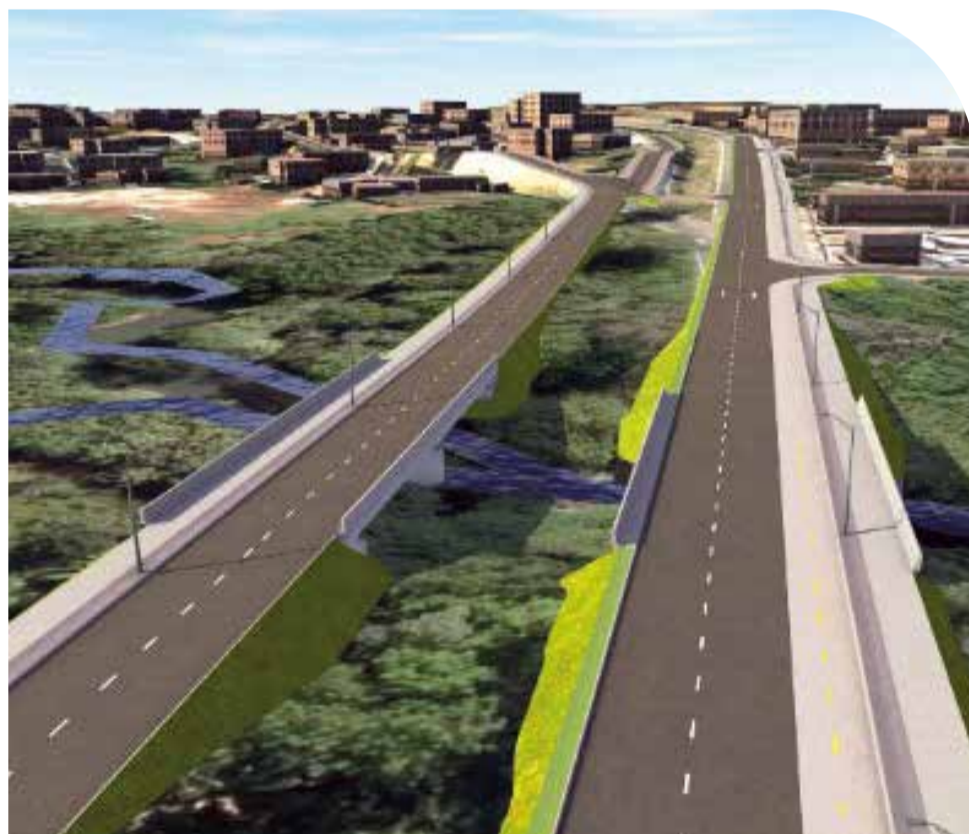
As obras incluem a duplicação do trecho dos lavajatos até o balão do Lar dos Velinhos, construção de calçadas, jardins e ciclovia

Depois de muitas promessas, a duplicação chegou a ser confirmada em outubro 2020, duran-