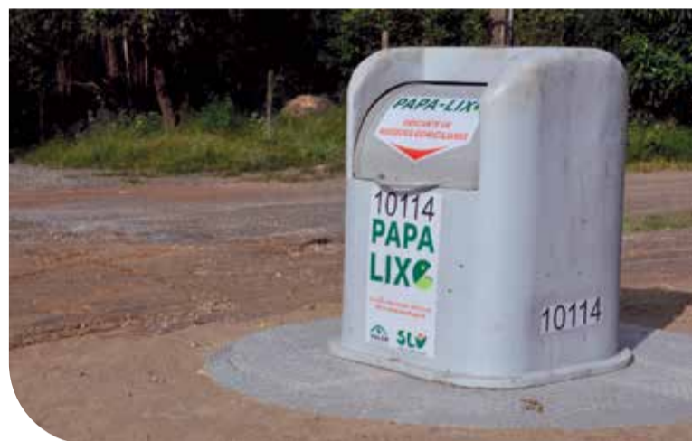
O papa-lixo é um contêiner semienterrado, preparado para receber resíduos da coleta convencional, ou seja, o que não vai para a coleta seletiva

Os papa-lixos são contêineres semienterrados preparados para receber resíduos da coleta convencional, ou seja, o que não vai para a coleta seletiva. O objetivo do equipamento é facilitar o descarte correto de resíduos de forma segura e limpa. Também é realizado um trabalho urbanístico e paisagístico em torno dos papa-lixos, criando uma nova utilização para as áreas que apresentavam acúmulo de resíduos dispostos de forma incorreta, transformando esses pe-