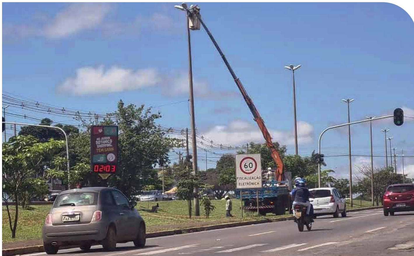
A previsão é atingir 70% da cobertura por lâmpadas de led no Guará ainda este ano

Iniciado em agosto deste ano, o contrato da Administração do Guará com a CEB Iluminação Pública chegou ao fim na última semana. Com investimento de R$ 792 mil, a instalação contemplou as quadras QE 38, QE 42, QE 40, QE 44, QE 46 e QE 48. Mais eficientes e econômicas, as novas luminárias também vão aumentar a segurança da população guaranaense. A iluminação LED traz ainda benefícios ao meio ambiente, maior durabilidade e baixo custo de manutenção