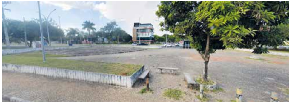
A abertura do festival será na Praça da QE 20, a Praça das Artes, que será recuperada pela Administração Regional antes do evento

Com as inscrições para artistas encerradas nesta sexta, 19 de janeiro, praças já começam a se preparar para apresentações