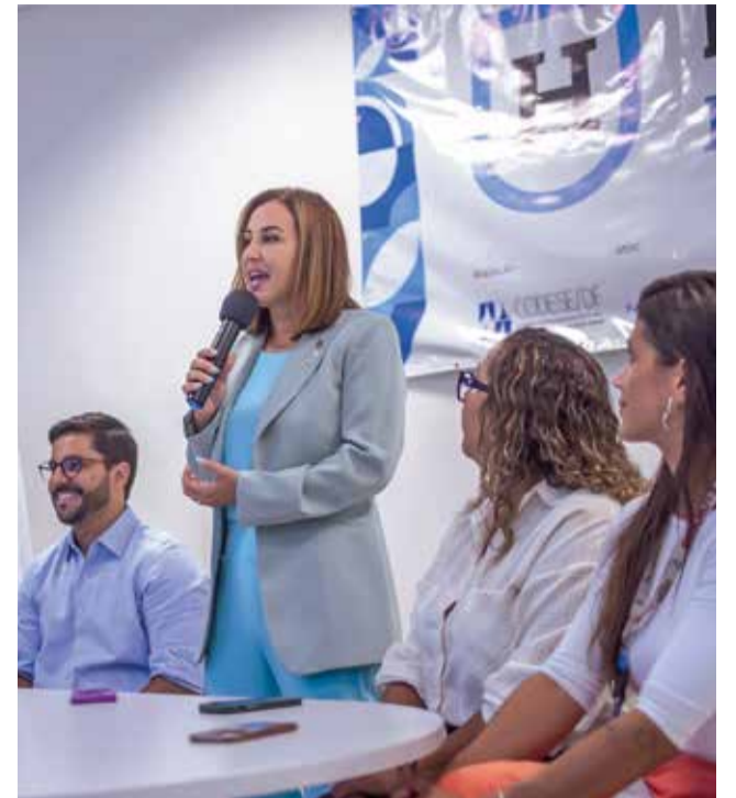
Autoridades e coordenadores do Hackacity Guar se encontraram na Escola Tcnica para o lanamento e explicaram a metodologia da incubadora. Na prxima semana, o Hackacity vai se encontrar com empresrios e diretores de escolas para divulgar as inscries

jetos j possui um histrico de sucesso, com edies anteriores que alcanaram resultados notveis. Incubados conseguiram acessar editais de fomento, como a Sector, a Arvorah e a Distrito Digital, beneficiados pelo edital Centelha. Alm disso, a rede de networking estabelecida pelo Hackacity facilitou o acesso a oportunidades, criando um grupo slido de empreendedores comprometidos com o desenvolvimento local.