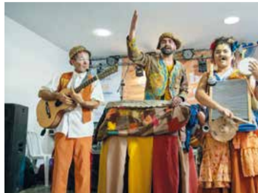
As atrações na 38, em sentido horário, é o grupo popular Mamulengo Fuzuê, a banda de reggae Deus Preto, o Duo Accordi, com viola caipira e piano, e a artista plástica Scorpia

Evento itinerante leva arte guaranaense para as praças da cidade. Quarta praça a ser visitada é ao lado do campo sintético da QE 38, no Bosque dos Eucaliptos