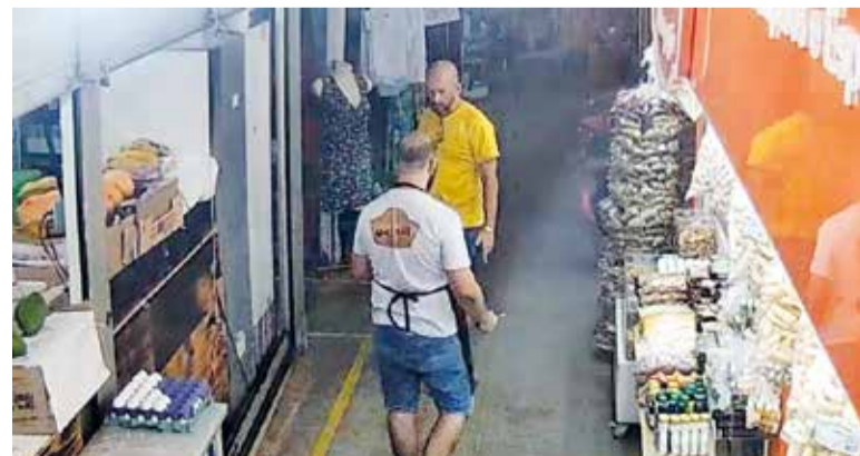
Vídeos que circulam nas redes sociais mostram discussões, xingamentos e agressões entre os dois lados

“O problema é que deparamos com muitas ações trabalhistas movidas por funcionários da Associação e, no caso de intervenção, o governo responderia de forma subsidiária, ou seja, poderia também responder às ações dos funcionários. Estamos aguardando ao parecer do corpo jurídico do governo para definirmos o que fazer”, explica. Mas a possibilidade do Comitê Gestor é contestada por Cristiano Jales, sob o argumento de que o governo não pode interferir numa instituição privada mesmo que seja o dono do espaço.