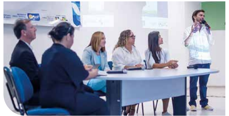
Evento de lanamento contou com a participao de autoridades e lderes comunitrios

A incubadora de projetos ajuda os interessados executarem, de fato, uma ideia em realidade empreendedora, como a criao de uma nova empresa, o desenvolvimento de um produto ou servio, a melhoria de um empreendimento existente, a criao de processos inovadores ou mesmo a formao de projetos sociais.