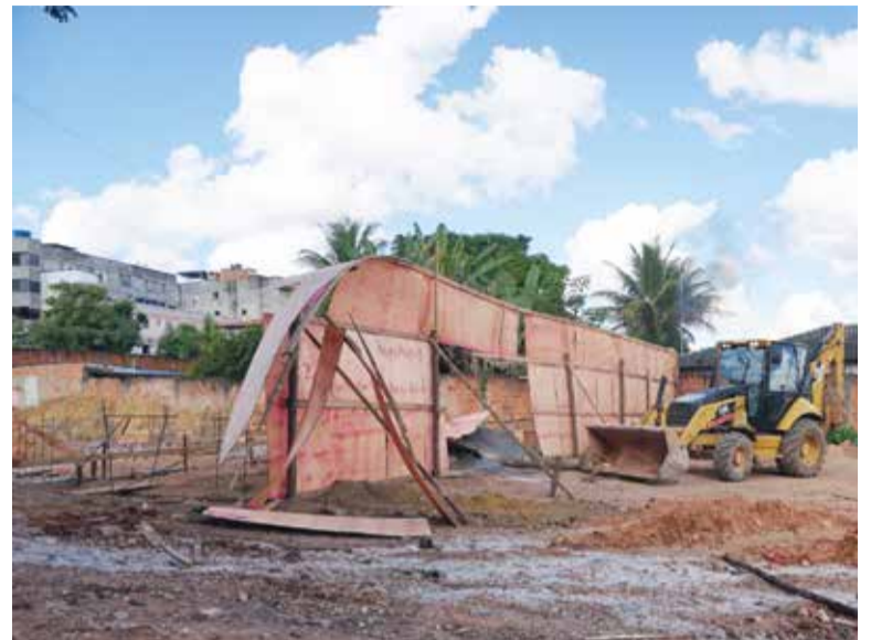
Operação da DF Legal no Guará desobstruiu área pública com uma construção irregular que já havia sido notificada

No ano de 2023, a DF Legal realizou no Guará 24 operações e desobstruiu 10.150 m 2 de área pública. De janeiro a março de 2024, quatro operações e liberou 1.760 m 2 de espaços públicos. As operações, que ocorrem em todas as regiões administrativas, são importantes para coibir a invasão de áreas públicas em todo o DF.