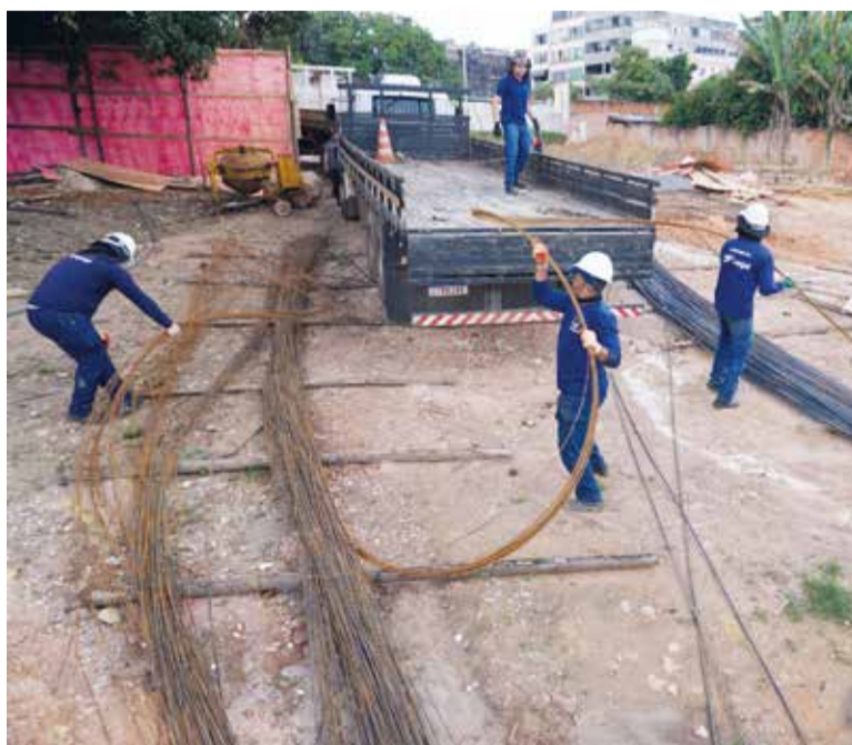
Os materiais e equipamentos apreendidos foram para o depósito da DF Legal, no SIA. O proprietário terá um prazo de 30 dias para reaver os seus pertences mediante pagamento de taxas referentes ao período de permanência no depósito, custo da operação e todas as multas pendentes