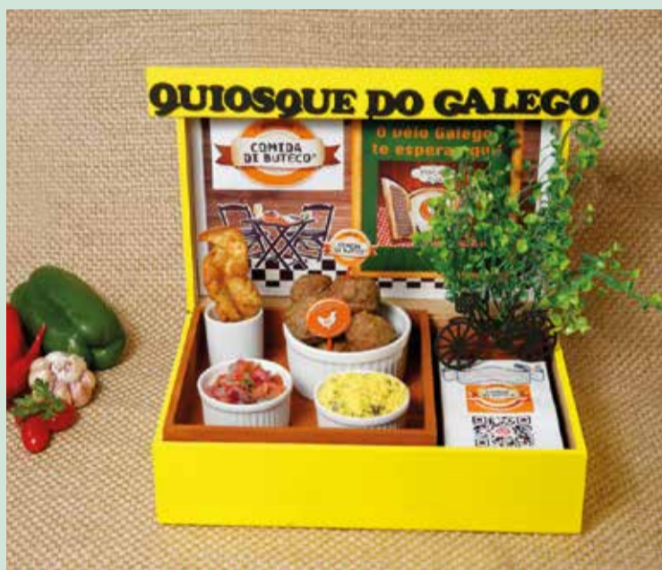
O Quiosque do Galego, na QE 19, apresenta as Bolinhas de Sabor do Galego (almôndegas conservadas em banha, com farofa de bacon e palitinhos de pastel)

res de petiscos e comida de buteco dispõem de muitas outras opções no Quiosque do Galego, localizado na praça da QE 19 do Guar4 II desde 1996. Uma das novidades bastante pedida é o Galetinho, único no Guar4, servido em meia porção, com farofa de ovos e batata frita, para duas pessoas, a R$ 32. Ou, os tradicionais espetinhos, como o Bafo de Bode (Cebola recheada com carne moída, cream cheese, envolta no bacon e assada na brasa, acompanhada de vinagrete e farofa) por R$ 22,90; Rabo Quente (Pimenta ardida, assada na brasa) por R$ 23; ou ainda o Mistura Boa (Banana com calabresa, envolta no bacon e