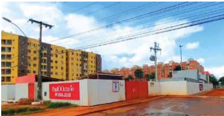
Obras do novo residencial já começaram na QI 23

O edifício terá, no térreo, ampla área de lazer. Estão incluídos itens como salão de festas, brinquedoteca, espaço gourmet, playground, pet care, área de delivery, coworking, espaço beleza, piscinas adulto e infantil, fitness coberto e descoberto, além de bicicletário.