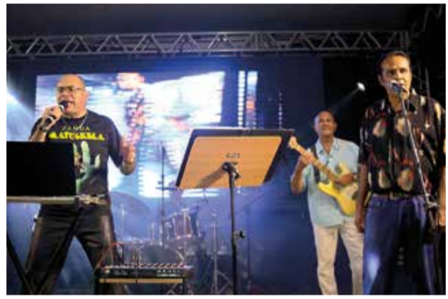
Banda Matuskela animou, e muito, a festa

Organizado pela Associação Comercial do Guará, o baile mais uma vez reuniu quem melhor representa a cidade, entre políticos, lideranças comunitárias, jornalistas e empresários.