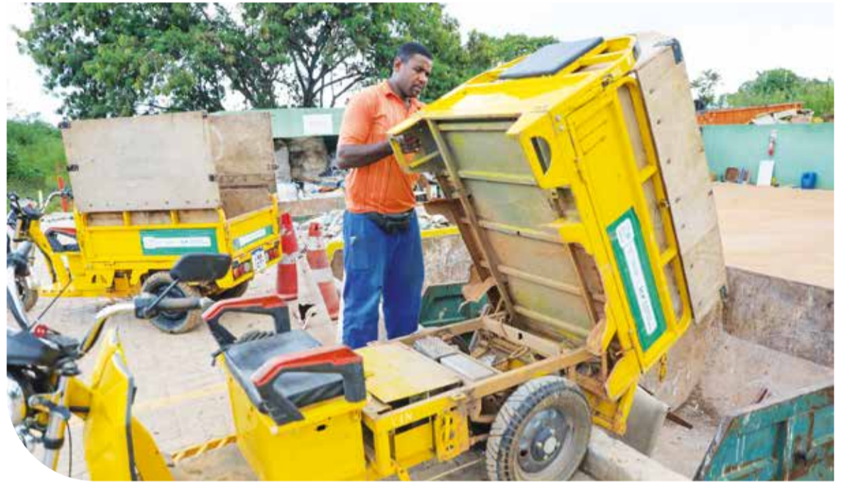
O objetivo do projeto-piloto Auto Eco Social é substituir as carroças de tração animal pelos tuk-tuks, triciclos elétricos que são operados por ex-carroceiros

“Nesse período de um ano e meio, nós transformamos os ex-carroceiros em verdadeiros agentes ambientais. Atuamos com o projeto em várias frentes, eliminando o sofrimento do animal, a redução da poluição sonora e atmosférica, e geramos renda para os trabalhadores. E assim, a quantidade de carroças no Guará foi diminuindo. Agora o SLU está elaborando novas soluções com outros órgãos do GDF para alcançar todas as regiões administrativas. Mas o serviço que nós co-