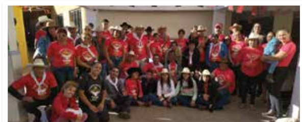
Os foliões do Divino de Jesúpolis (GO) no Centro Socioeducativo Santo Aníbal Maria