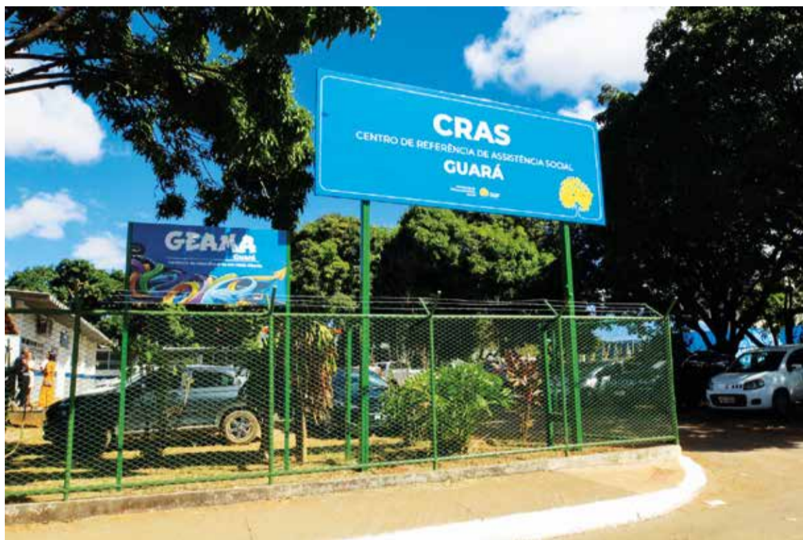
A unidade passou por pintura, renovao das salas, adequao dos banheiros, reforma de forro e telhado, melhorias na parte eltrica, limpeza e jardinagem

Localizado na Entreequadra 15/26 do Guar II, o centro de referncia atendeu, em 2023, 3.739 pessoas que solicitaram 2.498 benefcios, como os auxlios na-