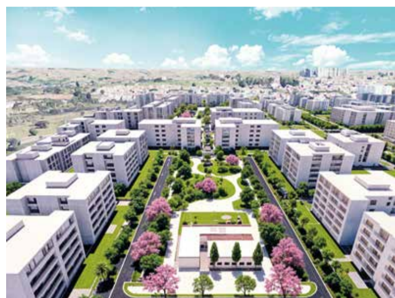
O projeto urbanístico da QE 60 contempla 107 lotes, sendo 92 unidades de uso misto, atraindo novos empreendimentos imobiliários e gerando empregos

No mês passado, a Terracap colocou em licitação um bloco de seis terrenos para edifícios de uso mis-