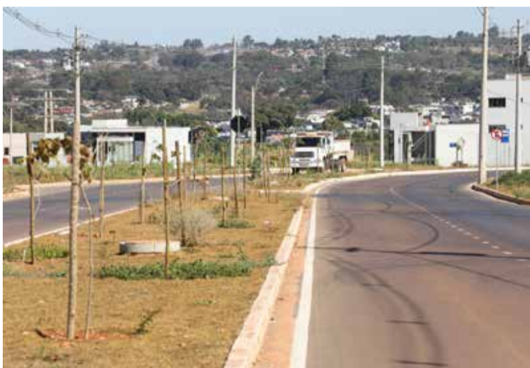
Quadras do Guará II receberam investimentos de R$ 17 milhões em obras de infraestrutura urbana, que incluíram pavimentação, estacionamentos e drenagem pluvial