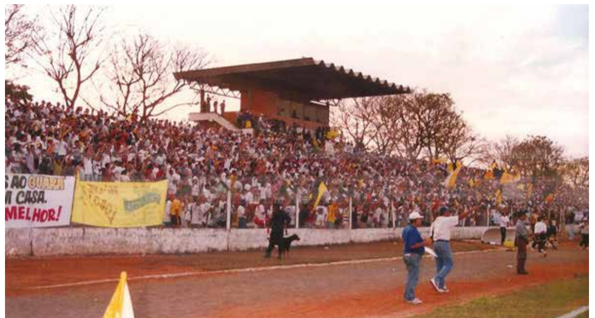
O estdio do Cave recebia entre 1,5 mil torcedores a 3 mil torcedores nas manhs de domingo

Torcida mesmo so quem tinham era Gama, Guar e Ceilndia - ainda no existia o Brasiliense. A mdia de pblico nas manhs de domingo no Cave era de 1,5 mil a 3 mil pessoas, considerado grande para a poca e para o futebol brasilien-