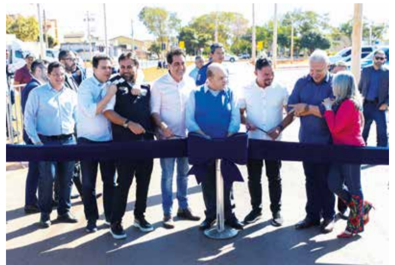
“A gente está dando retorno a todos os moradores desse local e eu tenho certeza que nós ainda temos muitas entregas para fazer aqui”, disse o governador Ibaneis Rocha, ao inaugurar, nesta quinta (25 de julho), obras de infraestrutura urbana no Guará II

Ao inaugurar as obras, o governador Ibaneis Rocha destacou as ações no Guará. “São R$ 360 milhões de investimentos numa cidade onde as pessoas diziam que não precisavam de nada e aí não faziam nada pela cidade. Agora, não, a gente está