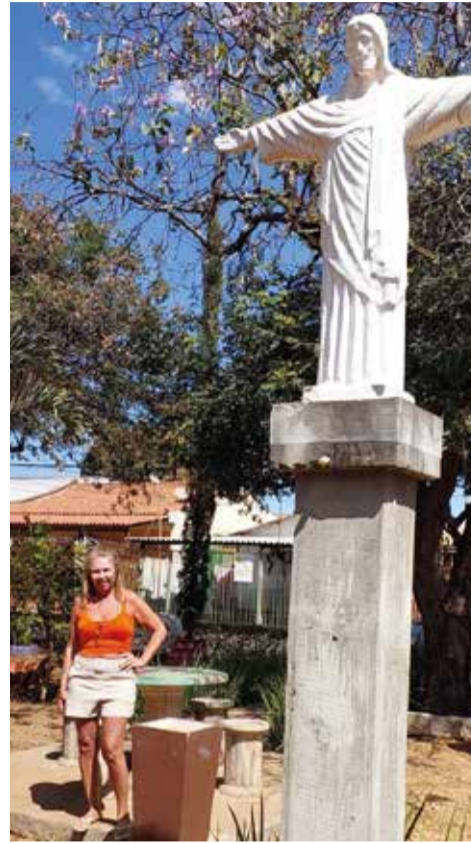
Uma estátua de 4 metros de altura orna o jardim implantado por Olinda, na orla da QE 13

Quem passa pela via contorno do Guará II, em frente à Administração Regional, não deixa de admirar um bem cuidado jardim em