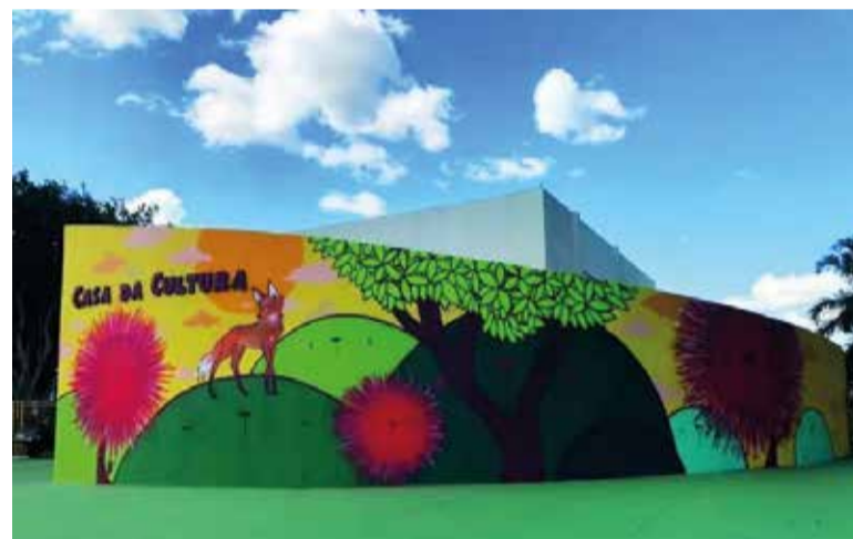
Casa da Cultura do Guará foi inaugurada em 2013 e até hoje não recebeu nenhuma reforma