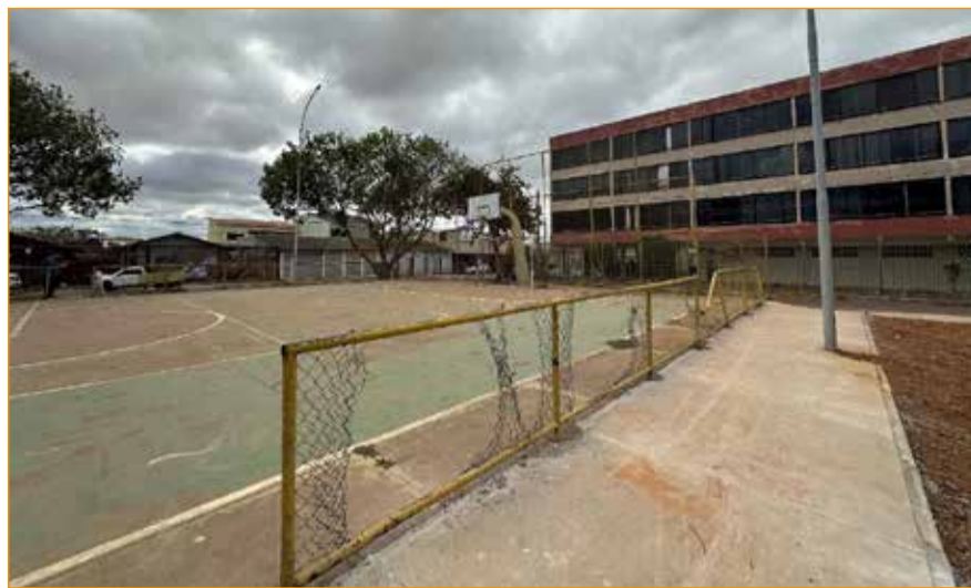
Praças da QI 14 (à esquerda) e Lúcio Costa serão as primeiras a receber as benfeitorias