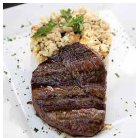
TORO PARRILLA com o Baby-Beef Angus acompanhado de baião de dois com bacon e queijo provolone - Park Sul