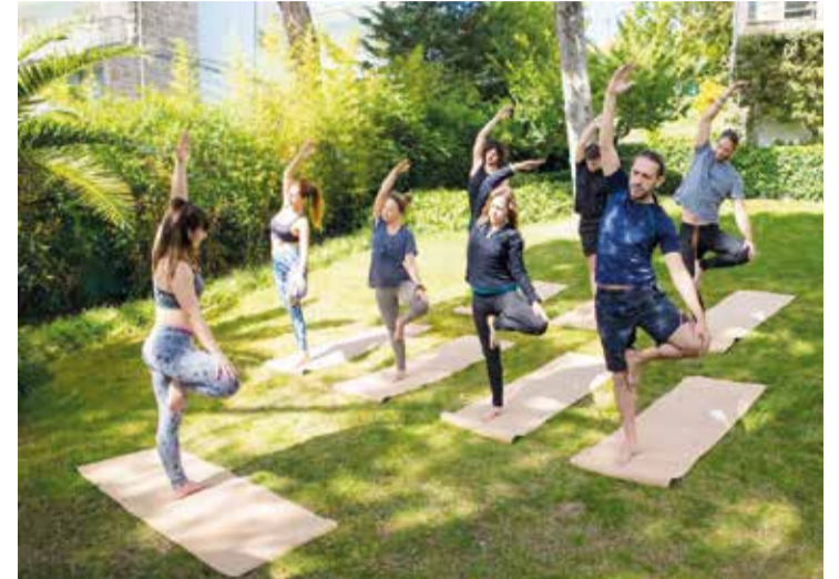
Com vagas limitadas, projeto ocorre de 25 a 29 de agosto no Parque Ecológico Ezechias Heringer

A partir deste domingo (25 de agosto), a população do Guarará e região poderá participar de aulas de dança, ginástica com bolas, treinos funcionais e caminhada para idosos. Todas as atividades serão ministradas por profissionais de educação física. O projeto, totalmente gratuito, segue até 29 de agosto (quinta-feira) no Parque Ecológico Ezechias Heringer. As inscrições são limitadas e estão disponíveis no site Sympla ( www.sympla.com.br/evento/auloes-gratuitos-ginastica-danca-e-alongamento/2599238 ).