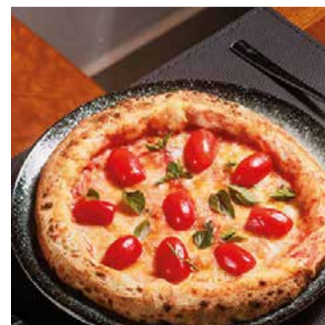
FORNERIA DI CAPRI com destaque para a pizza de Margherita - Park Sul