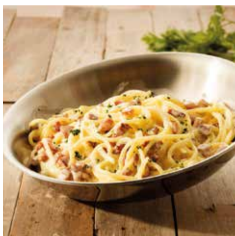
ABBRACCIO CUCINA ITALIANA com o Carbonara di Roma, parmesão, pancetta e gema de ovo - Park Shopping

rantes participantes, com opções para todos os gostos e bolsos, além de claro, uma grande oportunidade dos brasilienses desbravarem a conhecerem novos restaurantes por todo o DF.