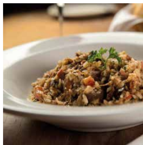
PECORINO BAR E TRATTORIA com destaque para Risotto de Cogumelos Trufados (vegetariano) - Park Shopping