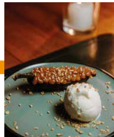
O Luzia Gastrô, na QI 2, oferece almoço (R$ 54,90) e jantar (R$ 69,90) tem entre as opções a croqueta de mandioca recheada com mix de cogumelos, Costelinha braseada com redução agridoce, Parmegiana gratinada de berinjela e 3 queijos e Banana assada recheada de doce de leite

Um dos principais festivais gastronômicos no mundo, a Restaurant Week chegou há 17 anos ao Brasil pelas mãos do empresário Fernando Reis. Além de São Paulo, onde começou, e Brasília, o festival é realizado em estados e cidades