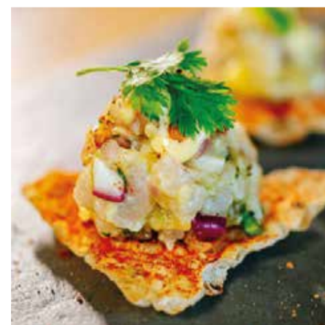
CASA BACO com o Tartar de Pirarucu, caju e baru e o Arroz caldoso de brasato e abóbora - Casa Park