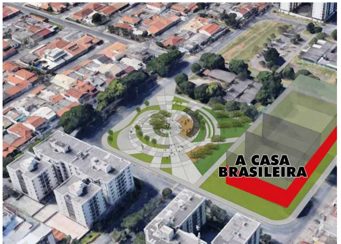
Praça será implantada na área atrás da galeria A Casa Brasileira

Quando foi divulgado pelo Jornal do Guará há duas semanas, o projeto da nova praça provocou muitas discussões nas redes sociais da cidade, a maioria questionando o fato do governo anunciar a construção de uma nova praça enquanto a maioria das existentes não recebe manutenção ou reforma há algum tempo. “Entendemos a preocupação dos moradores, mas é preciso esclarecer que essa nova praça será construída com recursos de compensação urbanística por conta de Termo de Ajustamento de Conduta (TAC), firmado em 2008 com quatro empresas que construíram grandes edifícios residenciais na orla do Guará II, como resultado do Estudo de Impacto de Vizinhança (EIV). Não temos, portanto, como desviar esse recurso para outro projeto”, explica o admi-