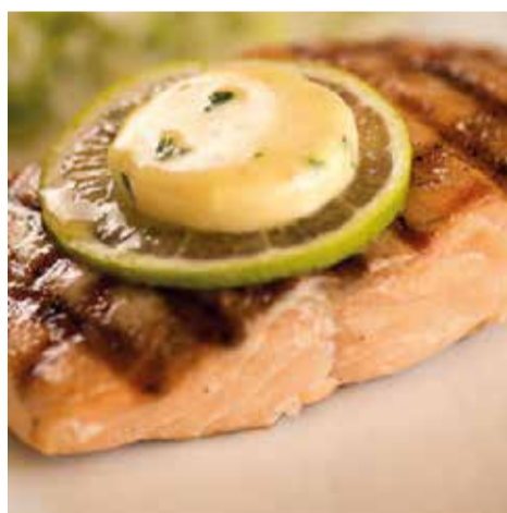
BARBACOA com o Bife Ancho, ou Salmão, servido com molho Belle Meunière - Park Shopping