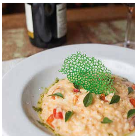
VINALLA VINHOS com o Filé de Robalo ao Molho Cítrico com Risoto de Limão Siciliano - Casa Park