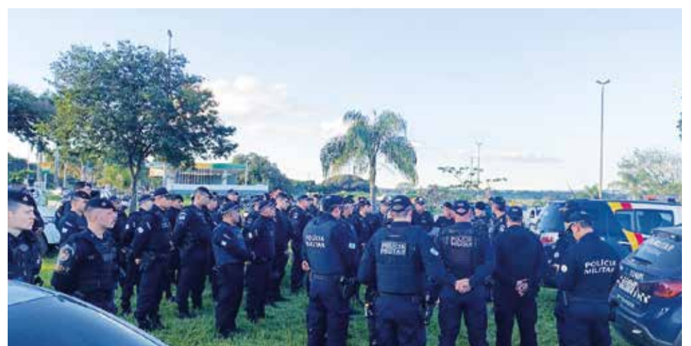
Operações integradas no Guará tem sido cada vez mais frequentes