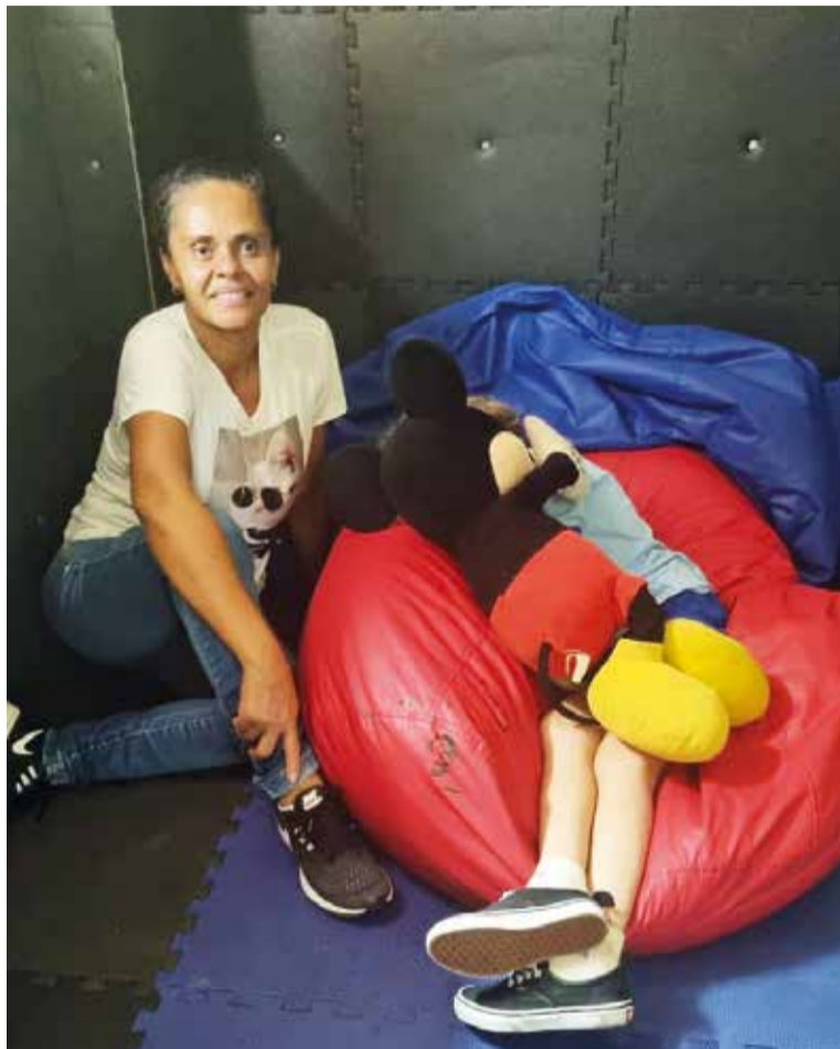
Monitora acompanha aluno durante desregula74o

Outra novidade da escola come7a a ser implantada na pr4xima semana, para o atendimento de estudantes “n4o falantes” (Quem n4o se comunica por meio da fala, mas utiliza outros recursos da linguagem verbal para se expressar. Isso pode incluir a escrita, a digita74o, a linguagem de sinais, entre outras alternativas). Em todos os ambientes - porta das salas, banheiro, refeit4rio, quadra, parquinho, sala de jogos, port4o de entrada, bebedouro e salas de aula - est4o sendo instaladas pranchas com as principais palavras para facilitar a comunica74o delas com os colegas e os professores. A escola 4, tamb4m, a primeira do Guar4 com adapta74o visual de todo o ambiente escolar.