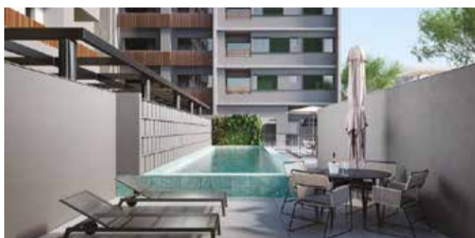
Perspectiva - Piscina adulto