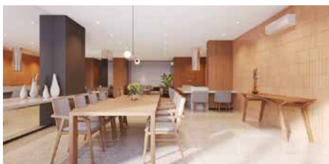
Perspectiva - Salo de festas