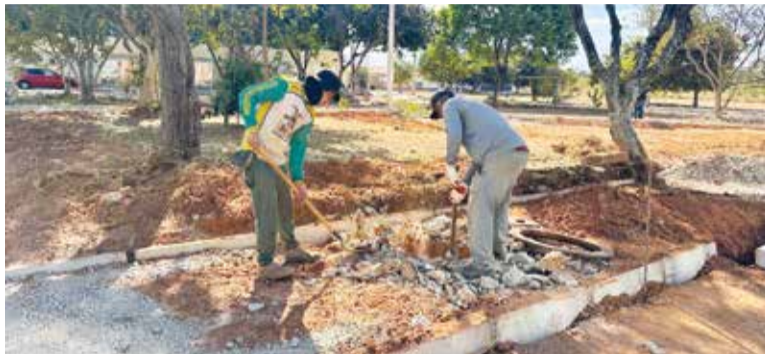
Obras nas calçadas do Guarará II, nas ruas e estacionamento da QI 20 e pavimentação na avenida contorno do Guarará II

“Mais segurança e mobilidade para a população guararaense. Agradecemos ao governador Ibaneis Rocha, a vice-governadora, Celina Leão, e deputado federal Gilvan Máximo, padrinho da nossa cidade, pelo carinho e investimentos. Seguimos,