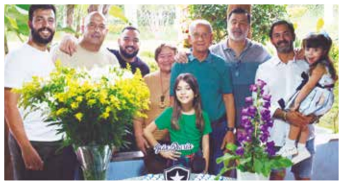
Paixão, lolanda com filhos e netos