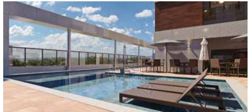
Perspectiva - Piscina adulto