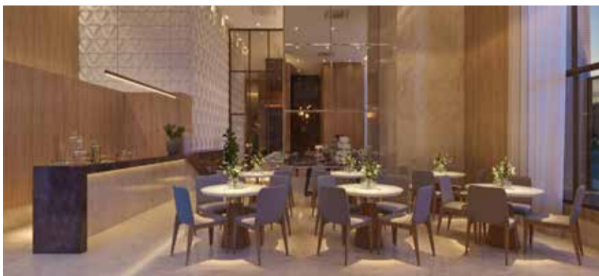
Perspectiva - Salão de festas