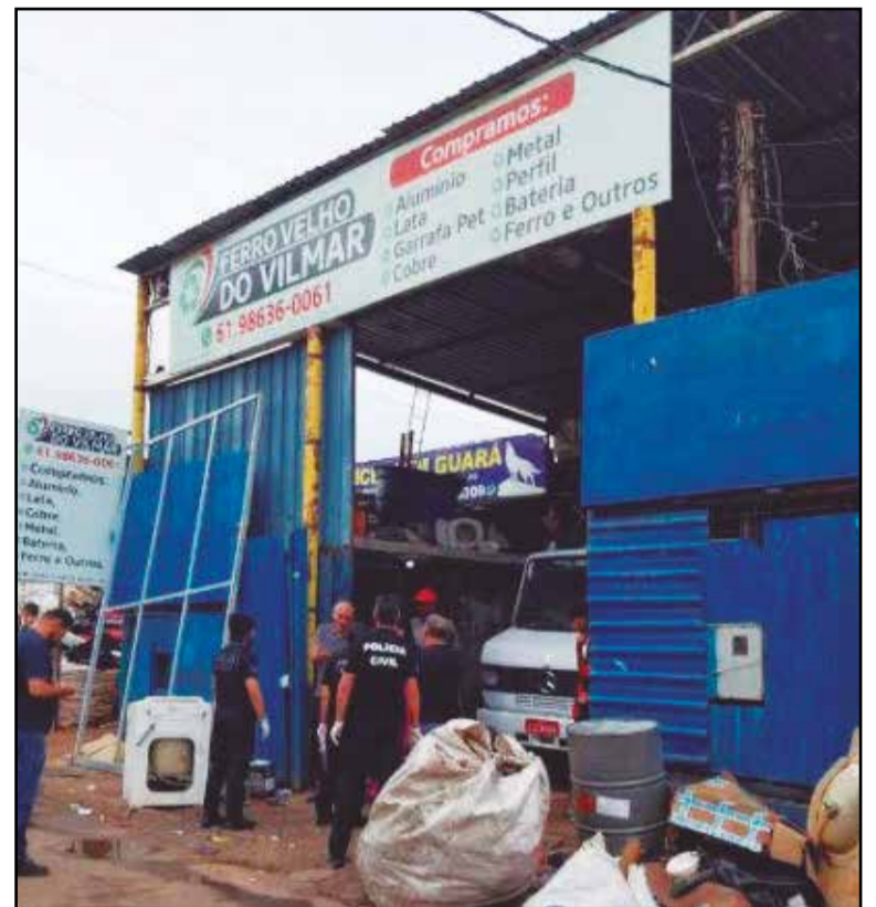
Ferro velho na QE 40 é um dos principais receptores de cabos de cobre furtados no DF, de acordo com a polícia. Com mandado de prisão, dono e genro estão foragidos

Já presidente da CEB Ipes, responsável pela iluminação pública, Edison Garcia, adverte que, além do prejuízo aos cofres públicos, os ataques à infraestrutura elétrica de iluminação pública da capital representam uma ameaça direta à segurança da população. “Os criminosos quebram as portas de acesso para manutenção e cortam a fiação. Com o