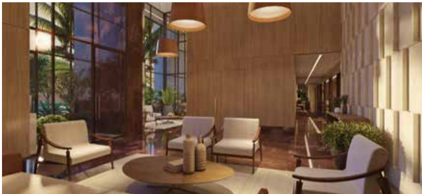
Perspectiva - Hall de entrada