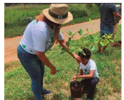
Projeto do movimento Tempo de Plantar promove reflorestamento com técnica inovadora de plantio em núcleos e mobiliza voluntários

seria possível sem a dedicação de voluntários e parceiros, que têm trabalhado incansavelmente nos plantios e na manutenção das áreas restauradas. Inspirado pelos princípios do Tempo de Plantar, o esforço coletivo transforma o reflorestamento em uma experiência de aprendizado e união.