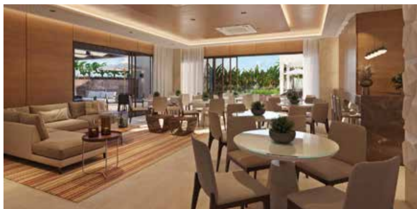
Memorial de Incorporação registrado no Cartório do 4º Ofício de Registro de Imóveis do Distrito Federal sob o número: R-7 M. 14916.