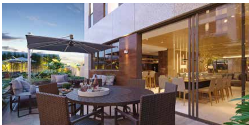
Memorial de Incorporação registrado no Cartório do 4º Ofício de Registro de Imóveis do Distrito Federal sob o número: R2/110.028.

Seja bem-vindo ao seu novo endereço de alto padrão no Guará.