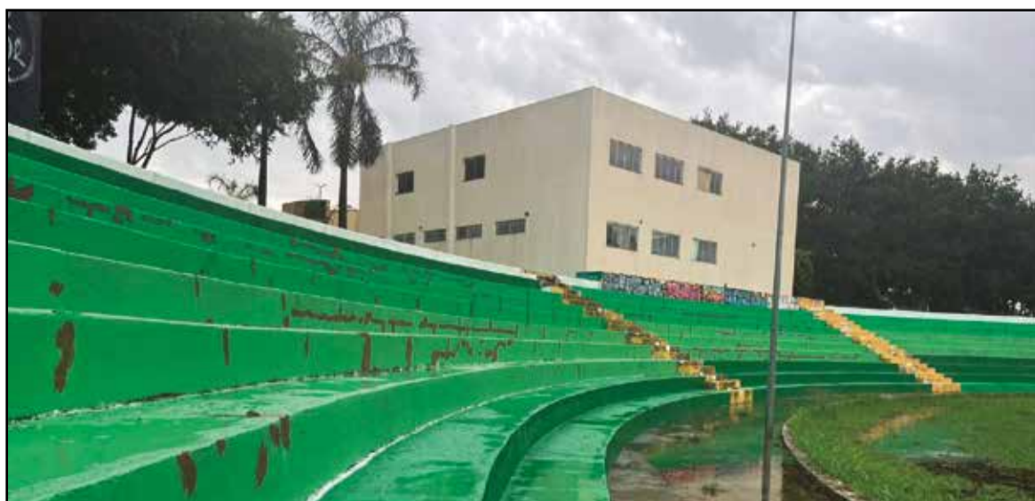
Manutenção compreende a pintura, banheiros públicos e nova iluminação do Teatro de Arena. Acessibilidade não foi contemplada e será feita no próximo ano

Com as reformas em curso e os planos futuros para a Casa da Cultura, o Guará caminha para recuperar dois de seus maiores patrimônios culturais. A expectativa é de que esses investimentos impulsionem não apenas a cultura, mas também o fortalecimento do vínculo entre a comunidade e seus espaços históricos.