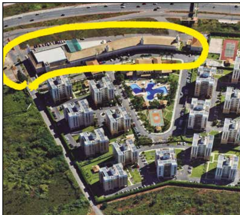
A Super Uqadra Brasília e o Flódia Mall (circulado em amarelo), com a EPTG acima