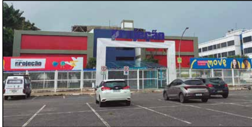
Faculdade vai funcionar onde é hoje o colégio Projeção, um dos mais antigos e tradicionais do Guará

acompanhada de uma expansão no portfólio de cursos da Faculdade Projeção. Entre as novidades, destacam-se cursos com várias opções tecnológicas, como Engenharia de Software, Banco de Dados, Tecnologia da Informação e Ciências de Da-