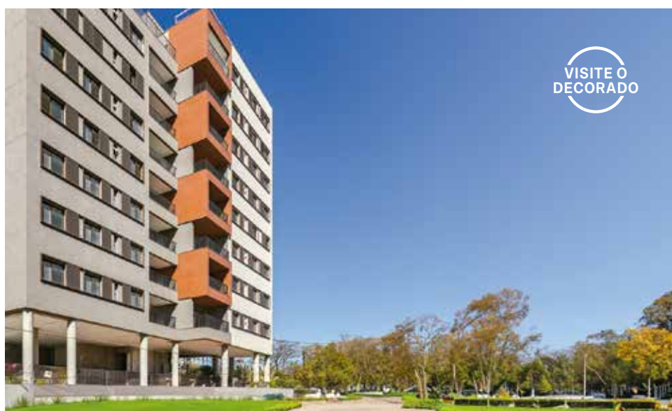
4º Ofício R.2.M.104.188