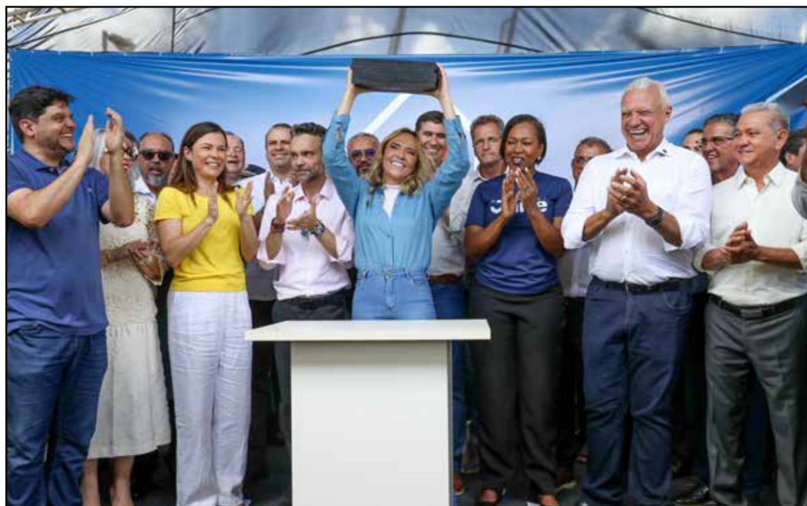
Programa, que será o carro chefe do restante do governo, foi lançado pela governadora Celina Leão durante o ato de sua posse

A iniciativa oferta serviços públicos itinerantes, por meio de gabinetes móveis, além da realização de mutirões integrados, com atendimentos de saúde, cadastro social, serviços do