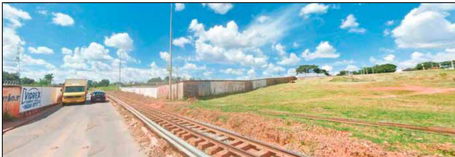
Integra4o com o metr4 ser4 constru4da entre o Guar4 II e o Guar4 Park

A 4rea no entorno da Rodoferrovi4ria, hoje sob gest4o do Ex4rcito, tem cerca de 4,2 milh4es de metros quadrados e 4 apontada pelo Minist4rio dos Transportes como pe4a importante para a modelagem financeira da concess4o. A proposta 4 permitir a explora4o imobili4ria no entorno da esta4o, dentro das regras previstas no novo marco legal