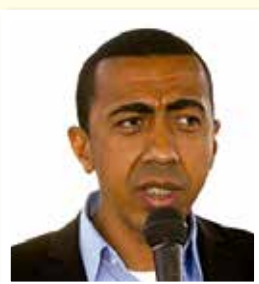
Renato Santana - de março a novembro de 2015. vice-governador do Distrito Federal, assumiu a Administração do Guará interinamente