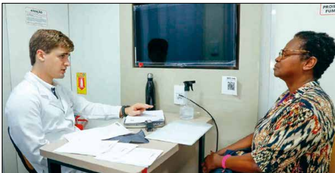
A medida integra a estratégia do governo de priorizar áreas essenciais diante do cenário orçamentário

A iniciativa também está alinhada à diretriz do governo de reavaliar o orçamento e direcionar recursos para serviços essenciais, com foco na melhoria da qualidade do atendimento prestado à população do Distrito Federal.