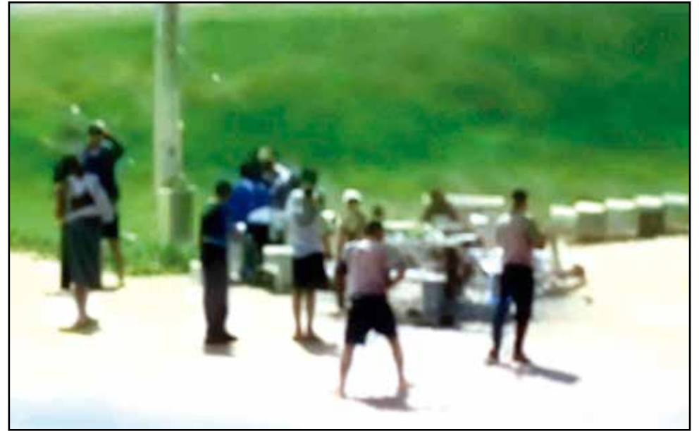
Estudantes se envolveram em briga em frente ao CEF 2, no Guará I, após o fim das aulas; episódio foi registrado em vídeo e aumentou a preocupação de moradores e educadores com a violência entre jovens na cidade.

A lembrança de casos graves envolvendo adolescentes e jovens no Distrito Federal reforça o alerta. No Guará, a comunidade ainda recorda a briga entre estudantes do Colégio Rogacio-