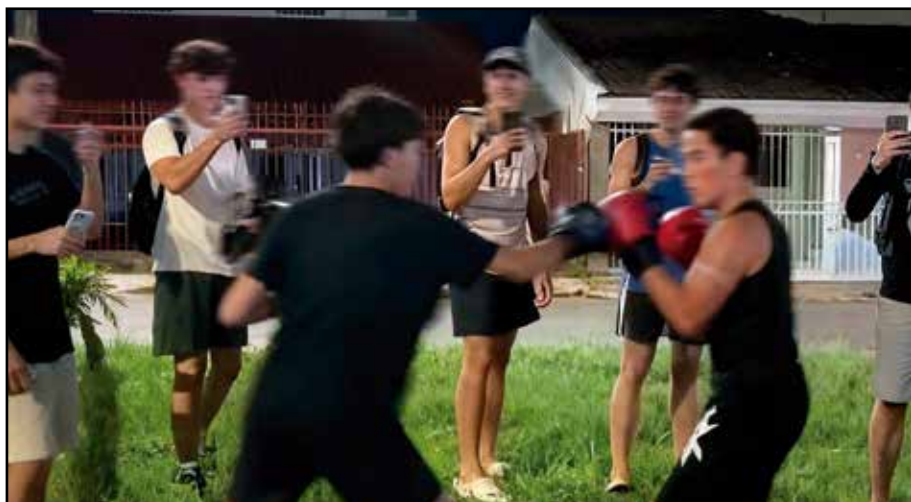
Jovens foram registrados em brigas em áreas públicas do Guará II, incluindo a QE 19, o CED 1 e a região do Polo de Moda, aumentando a preocupação de moradores.

motores de Segurança Cidadã, direcionado a estudantes do ensino médio. A proposta é fortalecer a escola como espaço de diálogo e formar jovens capazes de atuar como multiplicadores de práticas de respeito e prevenção à violência.