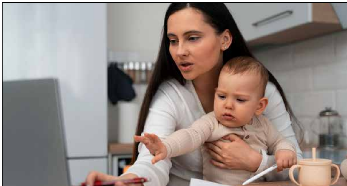
Entre prazos e cuidados, muitas mães vivem a sobrecarga de conciliar trabalho e maternidade no mesmo espaço

A chamada carga mental da maternidade vai além do cansaço físico. “É um cansaço profundo, que vai além do físico — é o que chamamos de esgotamento materno. Não é só fazer muitas coisas, é estar o tempo todo responsável por tudo: lembrar, organizar, antecipar, cuidar”, explica. Segundo ela, esse esgotamento se constrói de forma silenciosa, resultado de uma sobrecarga constante e, muitas vezes,